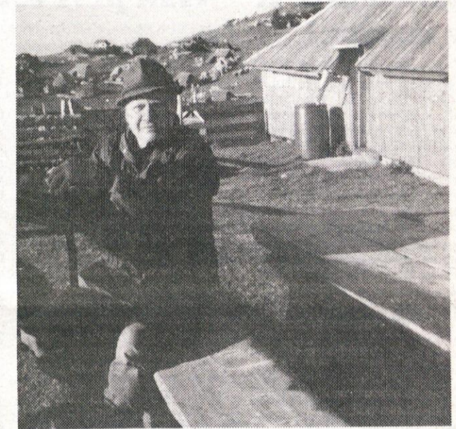
Stane Zamljen, Velika planina

Doma sem z Gozda, sicer pa živim v Kamniku. Na Gojsko planino hodim past že 25 let. Tu mi je zelo všeč. Letos imamo tu 14 glav, tako da je kar dosti dela. Sem pa kar zadovoljna, samo da ni bilo take suše kot lani. 11. junija, ko smo prignali na planino, nas je tu gori sprejel močan dež in sneg. Neverjetno, koliko turistov letos prihaja na planino. Toliko jih tu gori verjetno še ni bilo. Sem gor prihajajo zlasti tisti, ki pridejo z avtomobili do Ušivca ali do Marjaninih njiv. Še posebej veliko jih je bilo prejšnji teden, ko je bil v ponedeljek Veliki Šmaren.