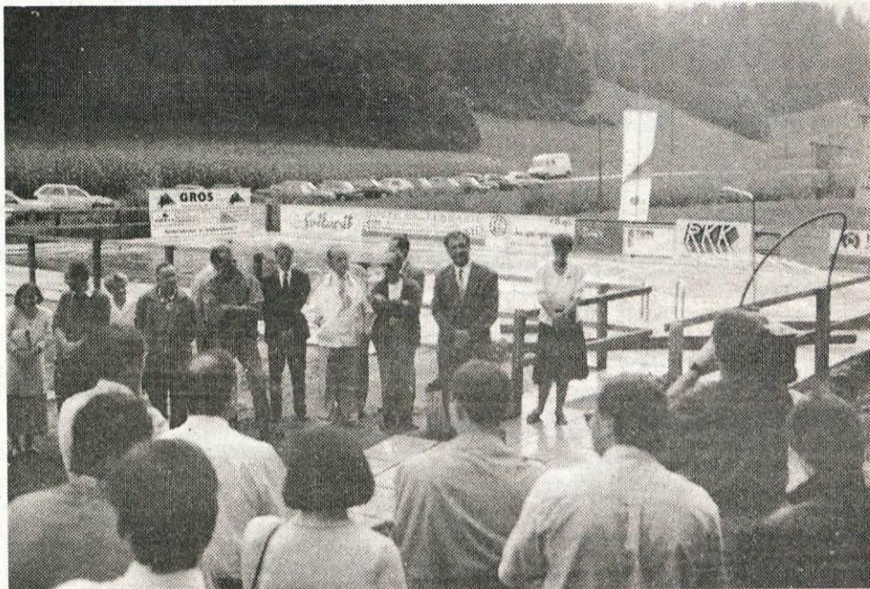
Za rezultate poskusnega bazena v Snoviku je med obiskovalci veliko zanimanja. Na sliki: Njegovo odprtje je pomenilo pravi praznik za Snovik.

Zaradi zahtevnosti projekta (Nadaljevanje na 2. strani)