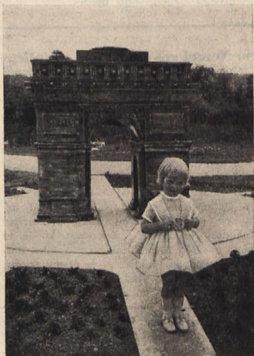
V vrsti znamenitih zgradb iz raznih držav vidimo na področju Minimundusa tudi pariški Slavolok zmage

Deželni urad za moderne učne pripomočke je začel s svojim delom leta 1946 pod najtežjimi pogoji. Danes pa je koroškim šolam na razpolago 1720 modernih učnih pripomočkov, med temi 600 projektorjev za ozko-trračne filme, 600 diaskopov, 500 episkopov, 20 projektorjev za zvočne filme in razen tega 3200 slik iz najrazličnejših področij.