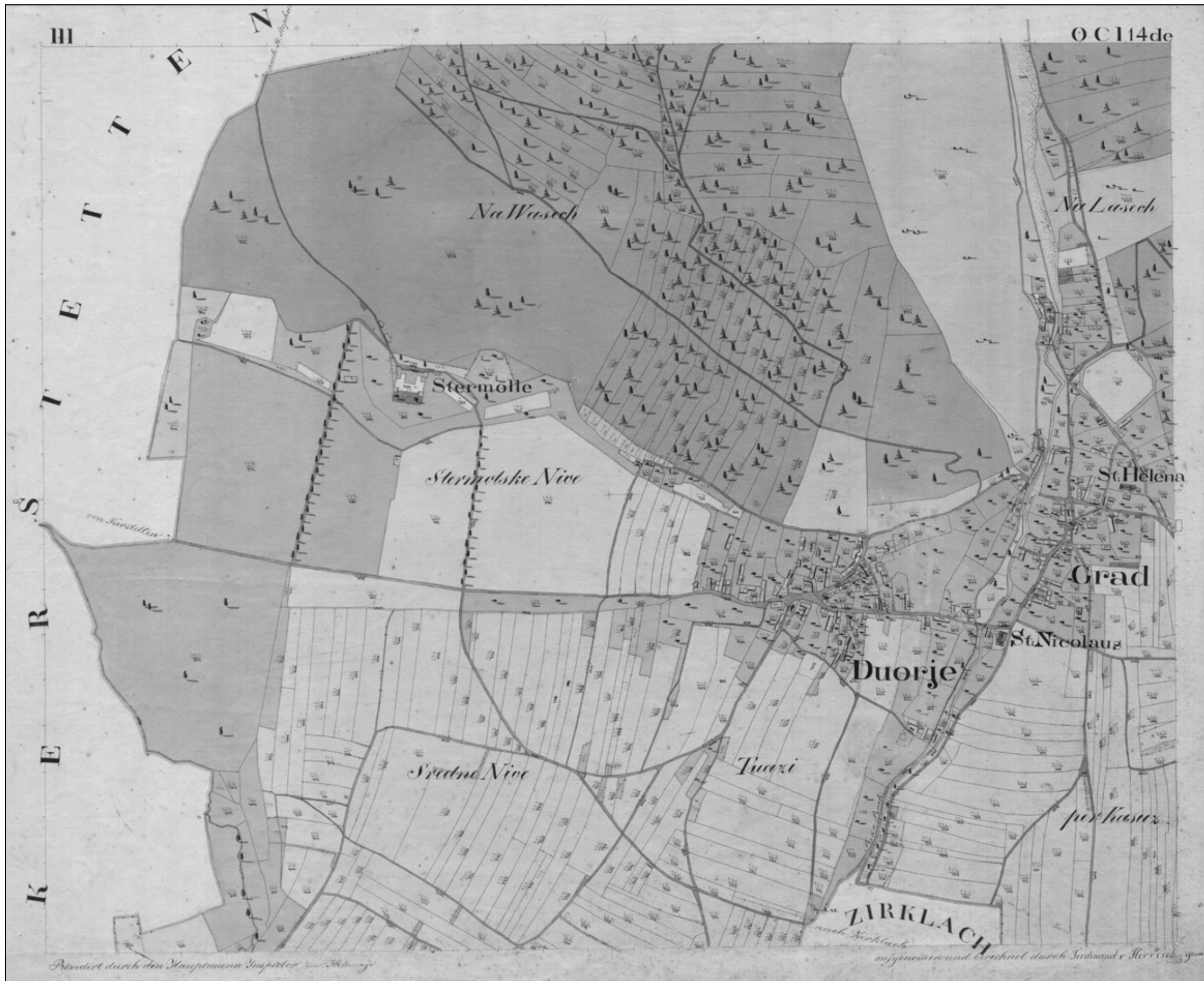
Strmol z okolico na franciscejskem katastru leta 1826 (AS 176, Franciscejski kataster za Kranjsko, k. o. Grad)