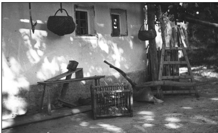
Kmečko orodje pred hišo (SEM, foto B. Orel, št. fotogr. 8287)

od 7 do 12 oralov, 8 četrtnskih hub, velikih 2 ali 3 orale, 27 osminskih hub, velikih en ali dva oralna ter 4 kajže, ki niso imele nobenega zemljišča.