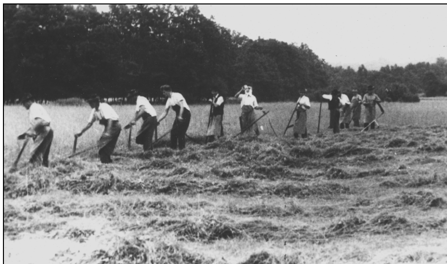
Kosci (Pokrajinski muzej Ptuj, št. fotogr. 18121)

Skozi katastrski občini Grad in Češnjevек je vodila okrajna cesta od Velesovega proti Kranju in Cerkljam, ki je morala biti vedno dobro prevozna, sicer pa je bilo na območju še več povezovalnih cest s sosednjimi območji, ki so bile nekaj slabše vzdrževane, in poljskih poti, ki so jih morali popravljati in vzdrževati prebivalci sami, zato včasih niso bile v preveč dobrem stanju.