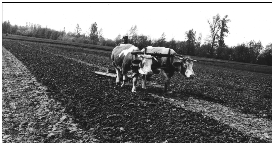
Brananje preorane njive (SEM, foto F. Šarf, št. fotogr. 8487)

dajali večinoma krmo sladke kvalitete, le na nekaterih predelih je rasla kislja trava, ki ni imela posebno velike vrednosti.