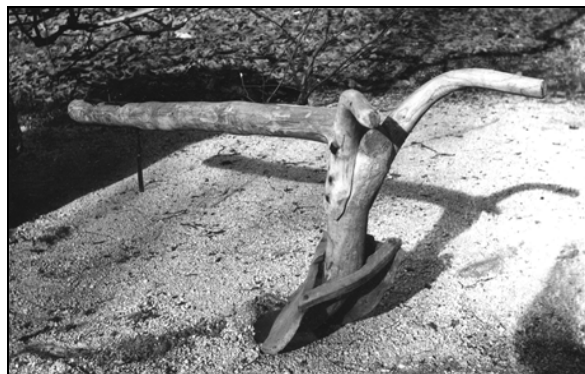
"Drevcelj", stari tip orala (SEM, foto F. Šarf, inv. št. 7790)

Mejo med katastrskima občinama Grad in Češnjevok predstavlja struga malega neimenovanega potočka, ki je bil parcelno numeriran v katastrski občini Grad. Iz potočka so tudi kmetje v katastrski občini Češnjevok namakali sosednje travnike, sicer pa tudi tam nimajo nobenih drugih večjih voda. 40