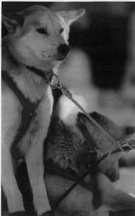
Fotografija z razstave: Polarni pes haski.