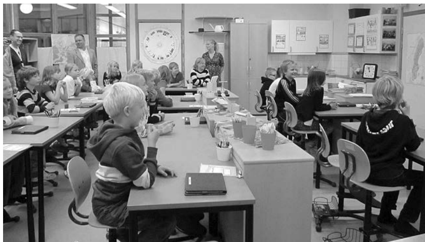
SLIKA 2 iPad pri pouku (študijski obisk na Švedskem leta 2012)

Soft, ki jo uporabljajo pri komunikaciji s starši in je podobna našemu eAsistentu, le da imajo učitelji pri zapisovanju dosežkov učencev nabor ciljev, ki jih označijo, ko jih učenec doseže. Hkrati lahko starši dnevno spremljajo svojega otroka in sledijo učnim vsebinam, ki se v določenem dnevu poučujejo. Letno načrtujejo šole le dve srečanja s starši in otrokom »v živo« in se pri tem držijo pravila »dve zvezdi« in ena izboljšava. To pravilo uporabljam sedaj tudi sama, ko spremljam pouk in skupaj z učiteljem analizirava opazovano uro pouka.