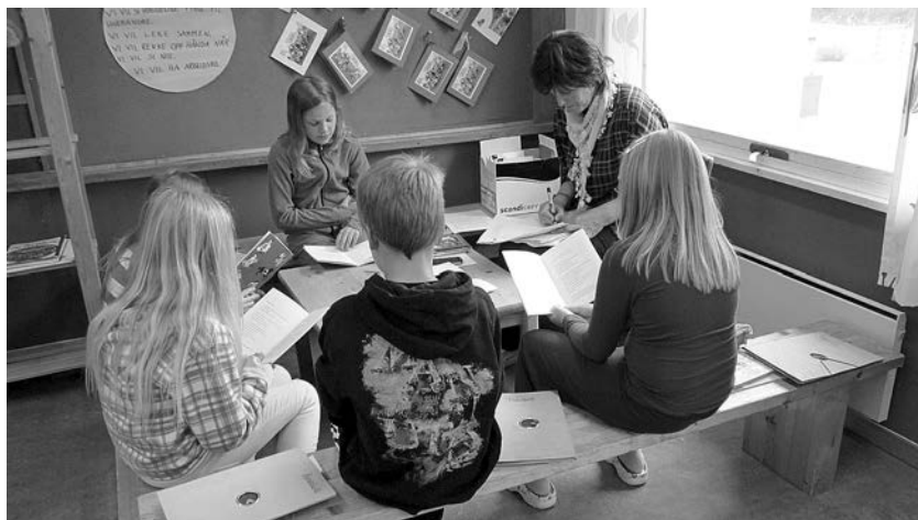
SLIKA 5 Spremljanje na- predka učen- cev pri bran- nju (Comenius na Norveškem leta 2012)

spremljam pouk v razredu, mi pogosto kakšen učitelj, ki je bil udeleženec mobilnosti, pove, da je to metodo videl v partnerski šoli in jo je uspešno preizkusil in prenesel v svoj razred. Učitelji so postali bolj pozorni na lastno poučevanje in na izboljšave v razredu, ki dolgoročno vodijo k izboljšanju učnih dosežkov učencev.