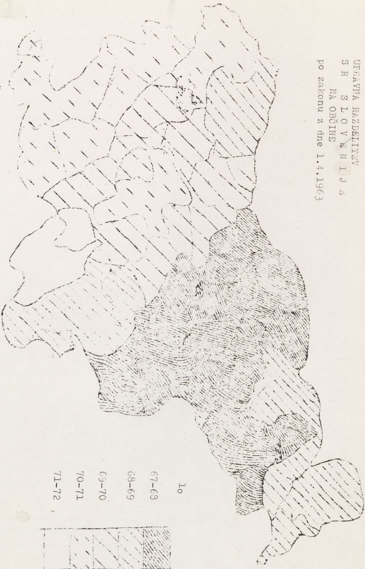
Sl. 2. Življenjsko upanje ob rojstvu v letih (Lo) po stanju 1960-62. Povprečki za moško in žensko prebivalstvo.