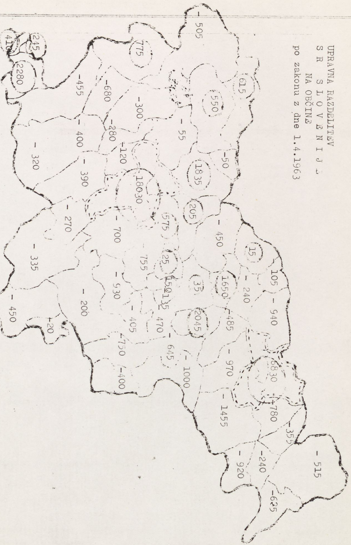
Sl. 5. Petletni (1961-65) sslitveni preseški občin SRS Zaokrožene številke predstavljajo pozitivne, nezaokrožene negativne vrednosti presežkov.