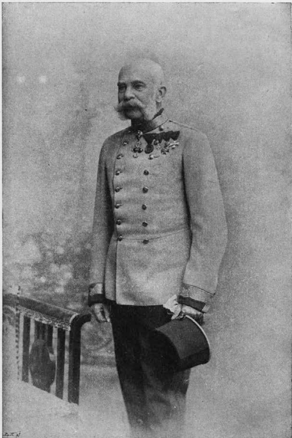
Cesar Franc Jožef I.