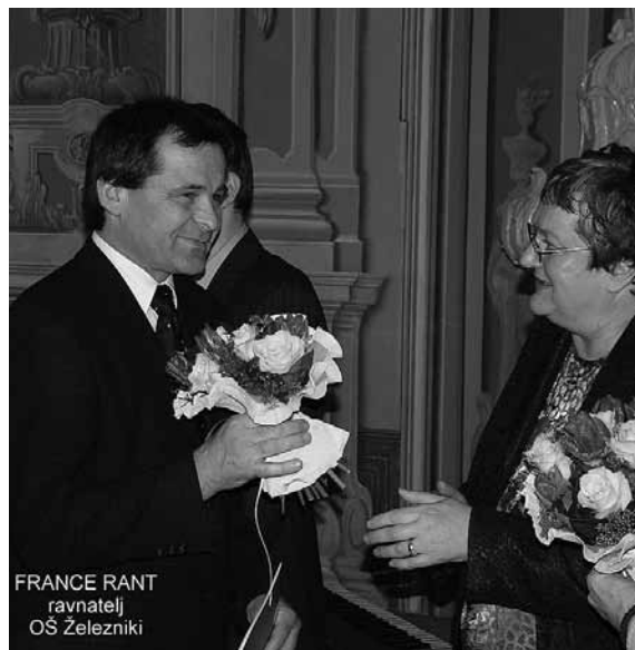
FRANCE RANT ravnatelj OŠ Železniki

V šolski okoliš Osnovne šole Železniki spada 29 naselij v zahodnem delu Selške doline. Šola vključuje podružnice – Davča, Dražgoše, Selca in Sorica – ter vrtec. Za živahno razpoloženje skrbi 700 učencev osnovne šole in 250 otrok v vrtcu. V okviru šole deluje tudi čipkarska šola, v katero je vsako leto vključenih okoli 150 učencev. S tem pomagamo ohranjati tradicijo našega kraja. Lahko bi rekli, da je naša šola usmerjena v prihodnost, saj smo z računalniškim opismenjevanjem začeli že leta 1994. Danes je šola sodobno opremljena, poučevanje pa je ustrezno temu. Zavedamo se, da so dobre rešitve v ljudeh in ne v stvareh, zato vzporedno z razvojem sodobnih učnih pripomočkov razvijamo tudi dobro sodelovanje med učenci, učitelji in starši.