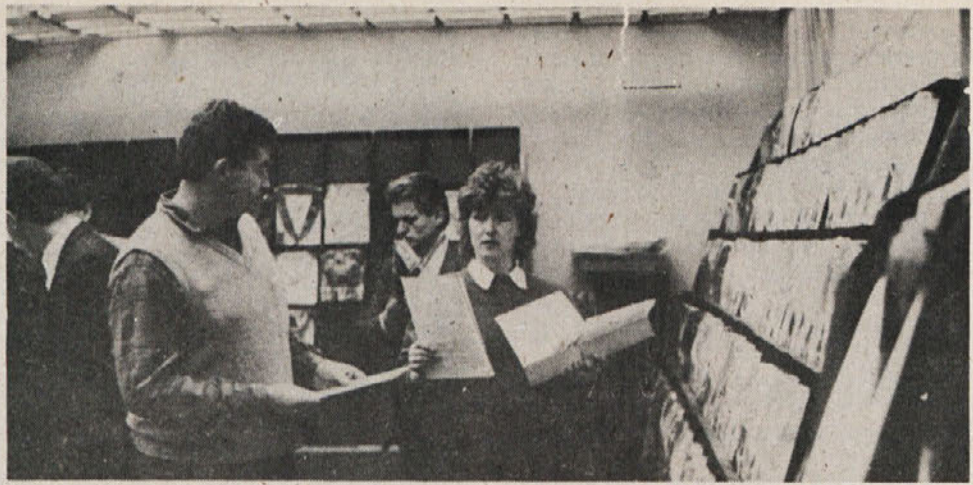
Iz vzorčne sobe

»Upokojitev sprejemam kot dejstvo — brez kakšnih velikih občutkov žalosti ali veselja. Zadovoljen pa sem, da sem oddelal svoje in da sem še kolikor toliko zdrav. Sicer so se mi v zadnjih letih nabrale težave, ki so posledica mojega dela in se kažejo pred-