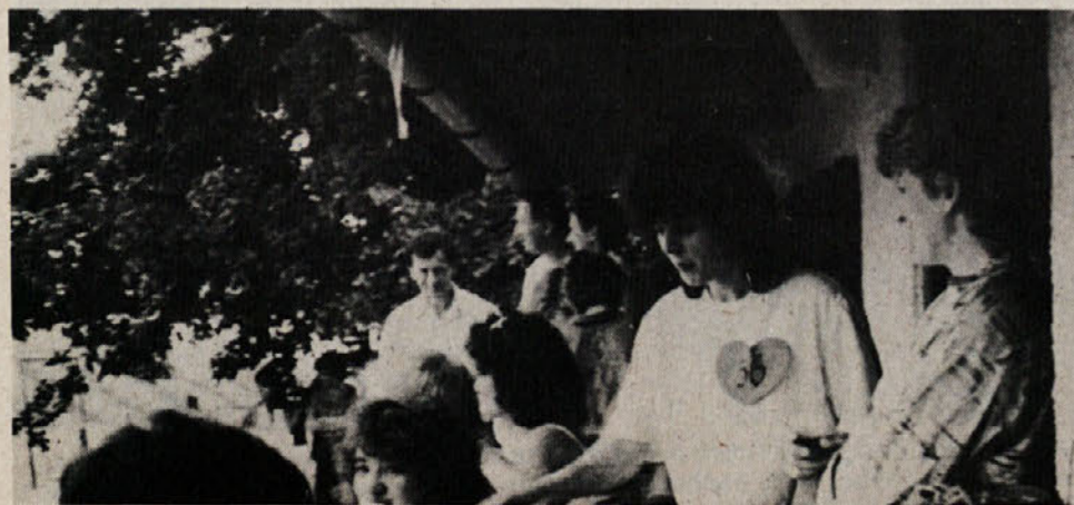
Srečka v obliki srčka. Pa še vsaka je zadela...