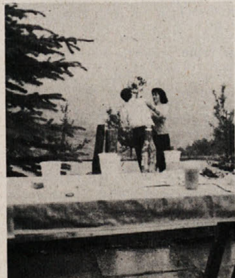
Dež nam ni mogel do živega, kaj šele, da bi pokvaril prijetno razpoloženje.