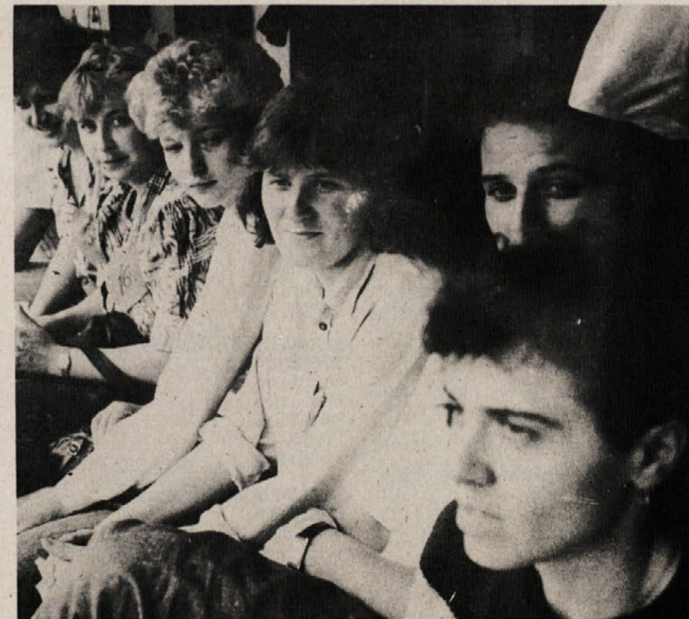
Šopek iz Delte...