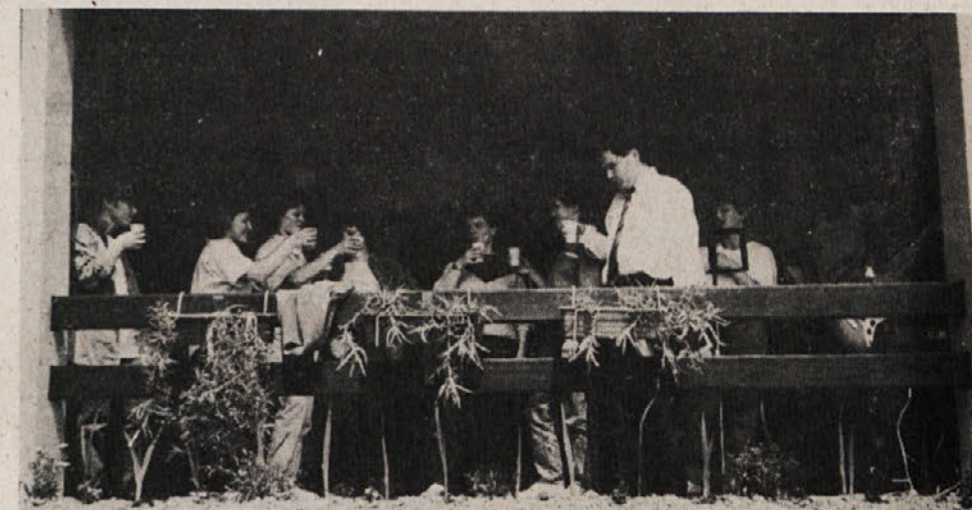
Za uvod v veselo razpoloženje na Sromljah so najprej nazdravili predsedniki OO ZSMS in za njimi še vsi ostali.