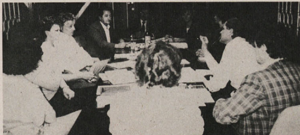
Na sestanku vodij proizvodnje in tehnologov s programa vrhnjih oblačil s predstavniki obeh priprav dela, razvojne službe in direktorjem tozda Commerce.

Oba sestanka sta bila dobrodošla, tako za pripravo dela kot tudi za vzporedne službe in seveda za proizvodne tozde. Konkretna dogovarjanja o problemih, ki so stekla na omenjenih sestankih, so nujna. Zato bi bilo treba zapisati le pripombo, da je škoda, ker niso bili prisotni vsi vodje proizvodnje, nujna pa bi bila tudi udeležba predstavnikov službe kontrole kvalitete (ta je bila prisotna le na sestanku programa srajc in bluz) in pa procesnega računalnika. V taki zasedbi bi lažje dorekli nekatera izpostavljena vprašanja.