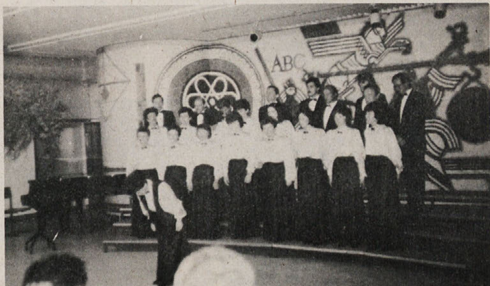
Idrijski mešani pevski zbor je nastopil tudi na prireditvi »Primorska poje«, s katere je posnetek. V našem tozdu Zala so pevкам sešili krila po meri, v Labodu pa so kupljene tudi bluže in srajce. Tako predstavlja priljubljeni pevski zbor tudi Labodovo ime.

4. junij je dan krvodajalstva. Letos praznujemo v Sloveniji že 35. letnico prostovoljnega krvodajalstva. Ta visok jubilej, ki govori o humanosti in človečnosti, torej lastnosti, ki jih naglo in površno življenje le ni še povsem in povsod izbrisalo, bomo obeležili tudi v naših okoljih. V počastitev praznika bodo poleg občinskih slovesnosti, na katerih bodo izrekli priznanja tistim, ki so darovali kri 25 in 50-krat, tudi mnoge interne slovesnosti. V novomeškem delu Laboda je že tradicija, da gredo naši krvodajalci v počastitev tega dne na izlet. Zaradi obilice delovnih obveznosti bo to letos nekoliko kasneje. V ljubljanskem delu Laboda so razveselili krvodajalce s pozornostjo pred praznikom. V Delti ponavadi čestitajo s priznanjem in posebno pozornostjo tudi krvodajalcem ob prazniku naše delovne organizacije. Poglejmo, koliko krvodajalcev je v Labodu: v Delti jih je kar 133, v ljubljanskem delu Laboda 25, v Idriji preko 20, v Libni 32, v Temenici 35, v Ločni 122, v Commercu Novo mesto 38 in v DSSS 18. Kot smo že pisali, je med nami veliko večkratnih krvodajalcev, več pozornosti pa bomo morali posvečati tudi pridobivanju novih, pri čemer naj bi bile v pomoč tudi mladinske organizacije.