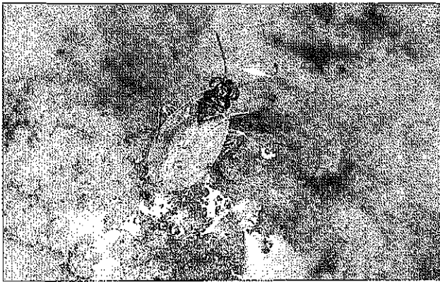
Fig. 3: Halosalda lateralis is known to live in Slovenia only at the Sečovlje salt-pans. Sl. 3: Halosalda lateralis živi v Sloveniji samo v Sečoveljskih solinah.