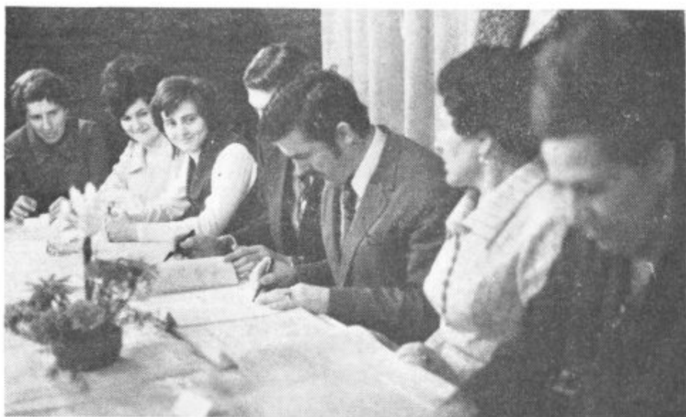
Vodje trinajstih delovnih enot podpišujejo temeljni samoupravni sporazum.

pooblastil zbora delavcev odločajo kaj bodo same reševale in kaj skupni organi. V delovnih enotah tudi ugotavljajo in samostojno delijo ustvarjeni dohodek. Pripomniti velja, da je v občini Velenje to drugi podpisani samoupravni sporazum. Pred njim so ga podpisali že v združenem podjetju Gorenje.