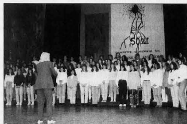
Zbor dijakov na proslavi 50-letnice obnove slovenskih šol v Italiji

Morda bo ta dan priložnost za razmišljanje o odnosu med življenjem in delom, med žensko in delom, med starši in otroki.