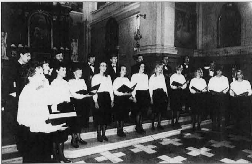
Zbor Jacobus Gallus v štandreški cerkvi septembra lani

S tem uspehom se je MePZ J. Gallus uvrstil v sam vrh slovenskega zborovskega petja. Pri tem je treba omeniti, da je zboru že pred dvema letoma na tekmovanju Naša pesem '93 v Ljubljani za las ušlo