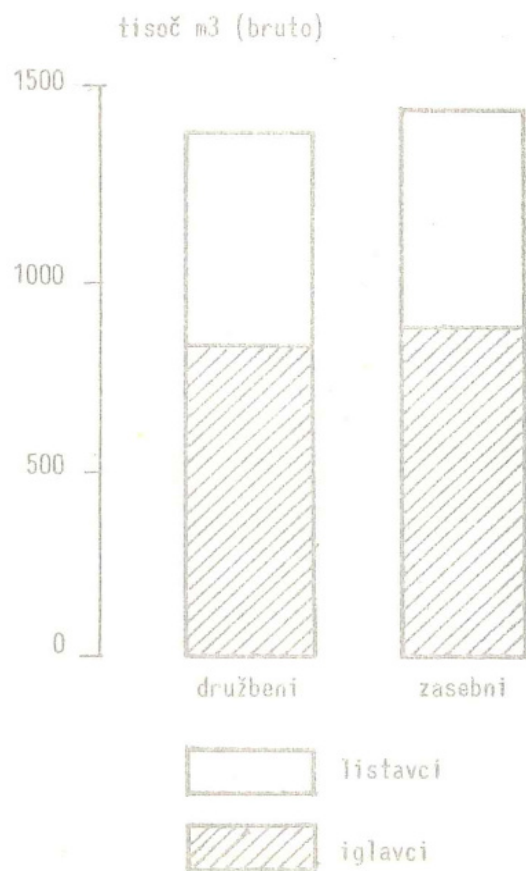
Sečnja lesa 1968 I.