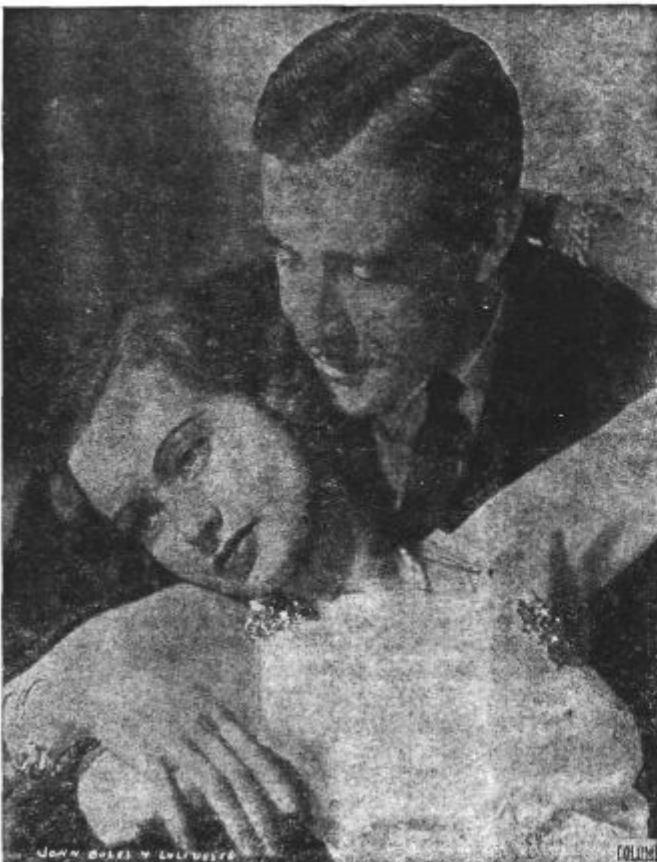
Iz filma »Moja boš«. Kino »Union«.