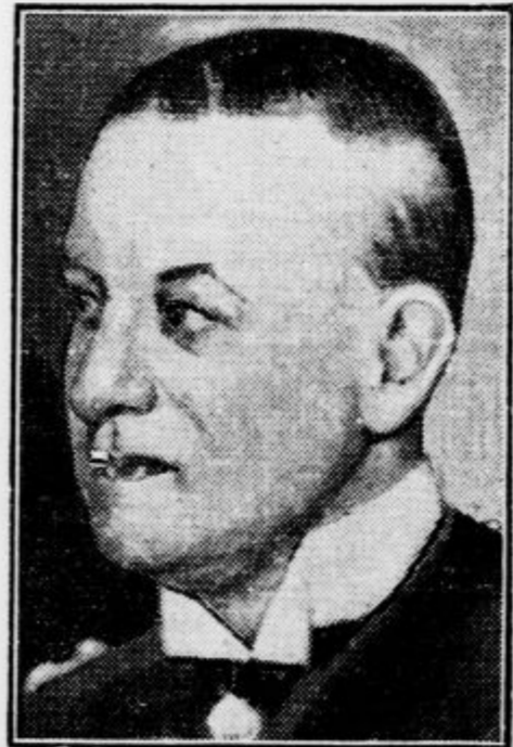
Nemški viceadmiral Röder, ki bo prevzel brambno ministrstvo, katerega je doslej vodil general Gröner.