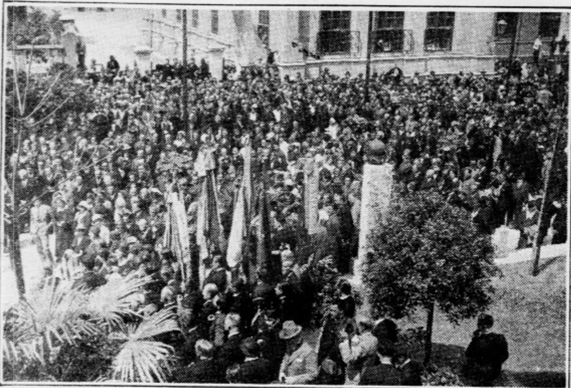
Pogled na množico, ki se je v ponedeljek dopoldne zbrala v Vegovi ulici k odkritju spomenika