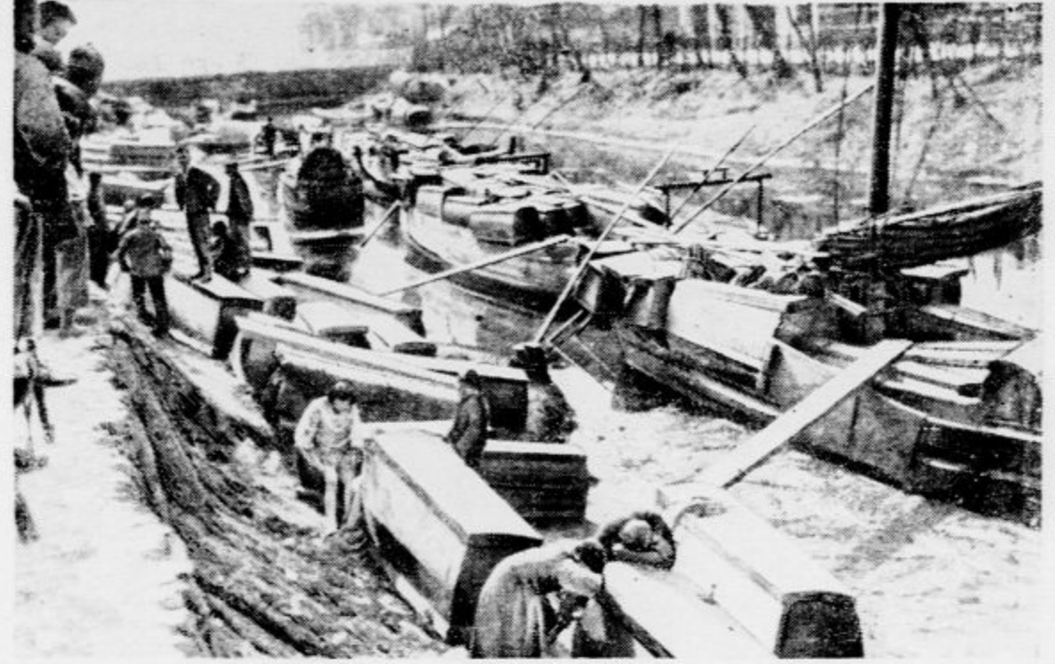
Kitajci so večji del svojih na šanghajski fronti padlih vojakov pokopali v skupnem grobu, ostale prevažajo zdaj z džankami domov. Slika kaže prizor z Rumene reke, kjer nalagajo krste na ladje. Spredaj ženske, ki oplakujejo pokojnike