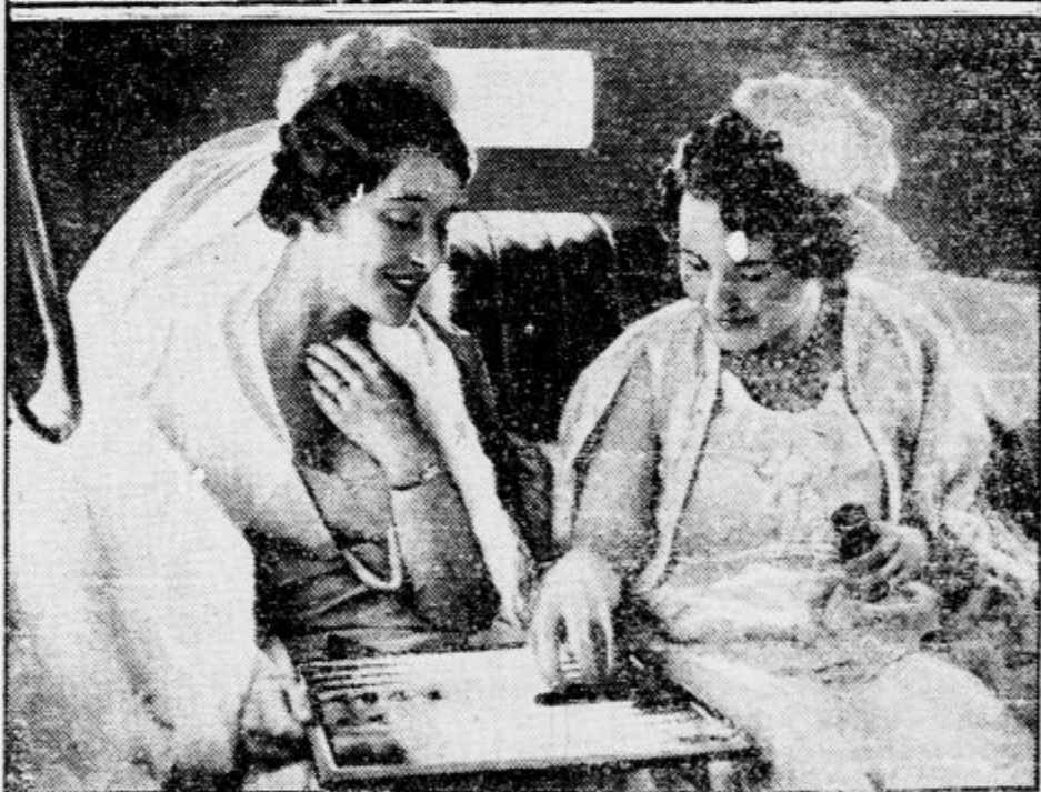
Največji dogodek pomladanske sezije v Londonu je sprejem mladih dam na angleškem dvoru. Za to priliko se mladenke pripravljajo z največjimi upi in z velikim strahom. Na zgornji sliki vidimo avtomobile z mladimi debutantkami pred vhomom na dvor, spodaj pa dve lady, ki si krajšata čakanje v avtomobilu