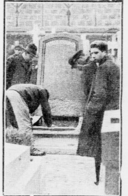
Grobniča rodine Doumer, kjer so položili k večnemu počitku predsednika Paula Doumerja na pokopališču Vaugirard.