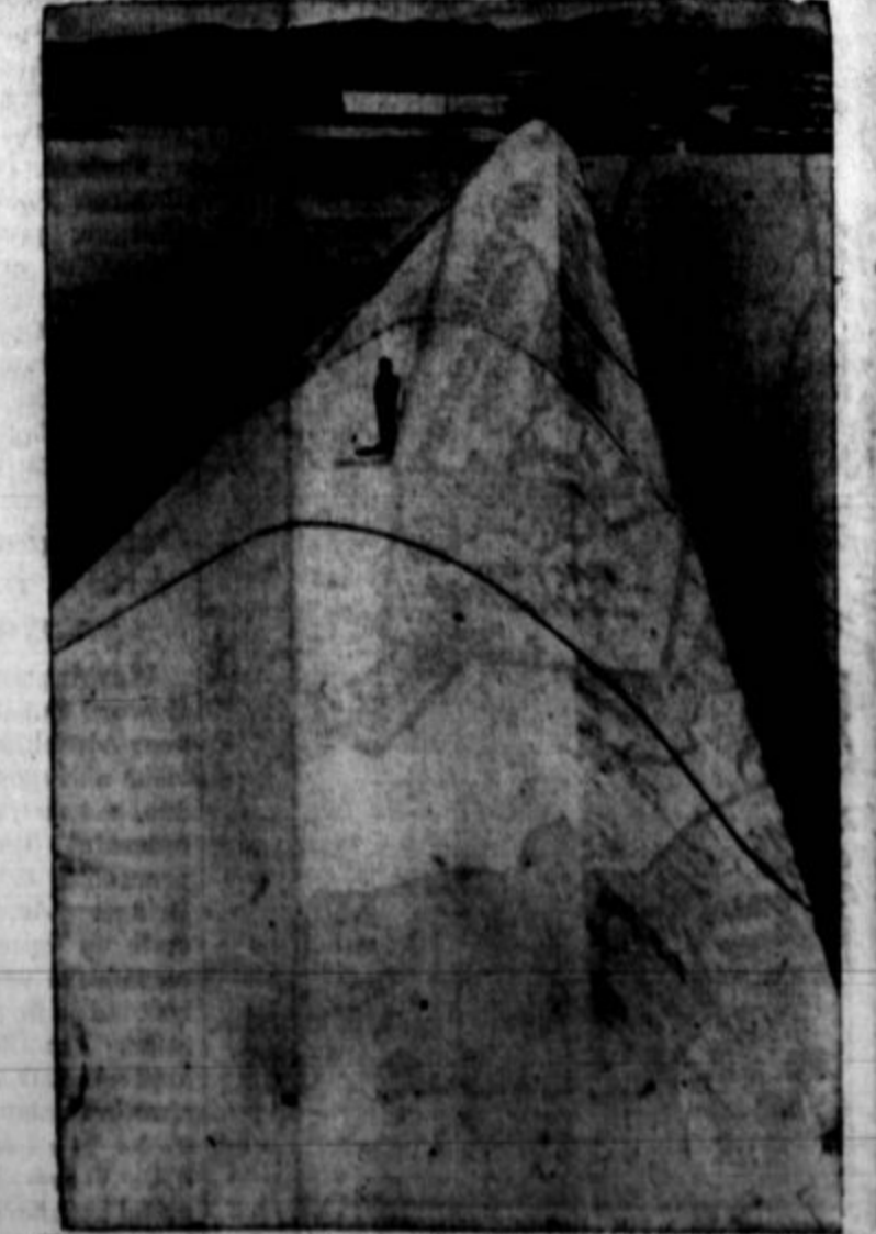
Slika kaže jez ob reki Colorado, 300 milj. nizeje od Boulderškega jezusa.

Sovjetska Rusija. Zavezniške čete prodirajo Rusijo na severu, z juga in iz vzhodne Sibirije. Boljševiki se morajo boriti s pol tuceta vražniki.