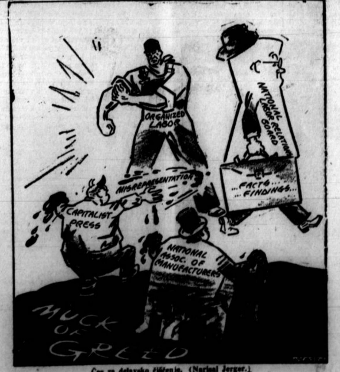
Čas za delavsko čiščenje. (Narisal Jerger.)

Mexico City, 15. avg. — Pet potnikov se je ubilo, trinajst pa je bilo ranjenih v koliziji dveh vlakov v bližini glavnega mesta Mehike.