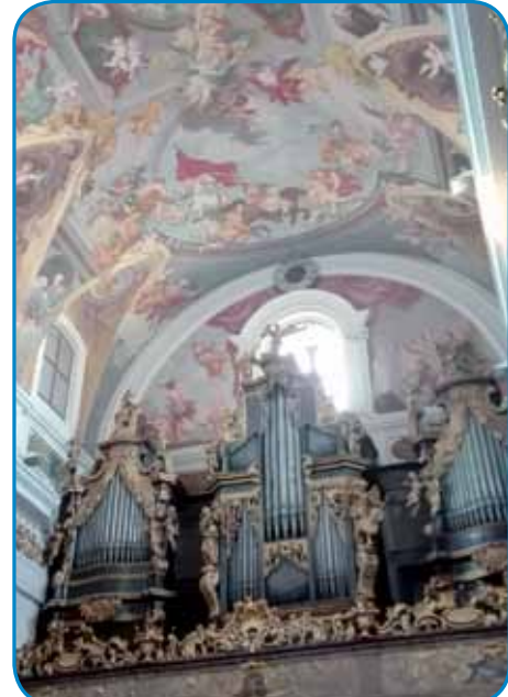
Orgole ljubljanske stolnice so pri sobotnoj meši tüoma ostale

»Nebotičnik« zovéjo tisto ljubljansko zidino, štero so zozidali v 1930-i lejtaj, pa je bila tistoga ipa najvišiša kuča na cejлом Balkani. V moji študentski cajtaj