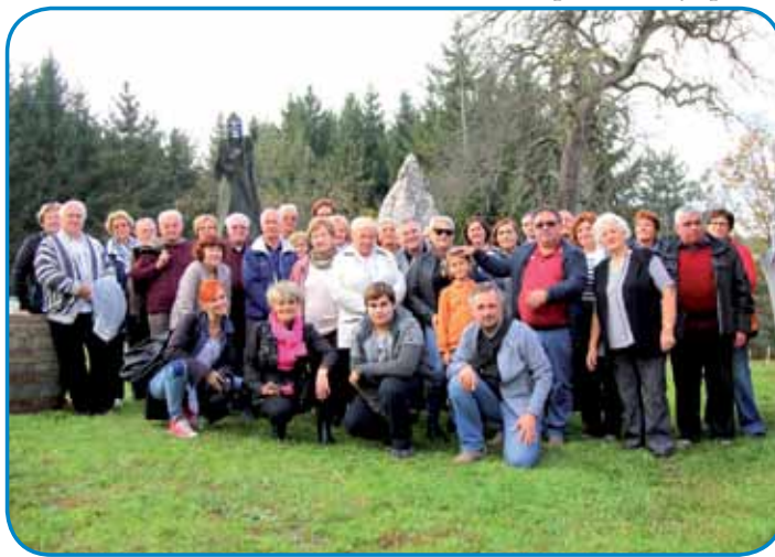
Člani Prekmurskega društva General Maister so bili že večkrat na obiski v Porabji

sam biu več kak sedem let slovenski predstavnik pri Europoli, organizaciji, stera skrbi za povezovanje po-