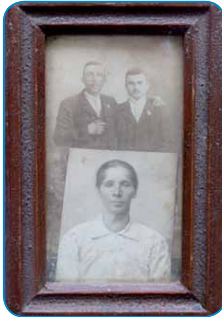
Stari oce (z lejve) pa stara mati (moli kejp)

- Kakšno je bilau življenje tü v Ciganjskoj gasi?