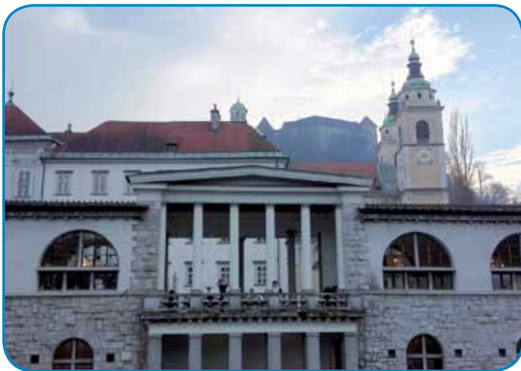
Tržnica (senje), katedrala svetoga Nikolaja ino grad - tri erične zidine Ljubljane

šom ranč tak rasté najstarejša vinska trta na svejti, štiristau lejt staro grauzdje z Maribora. V Ljubljani vsikše geseni ranč tak gvüšno vösprešajo en par litrov žmanoga črnoga vina, šteroga lejpo imé je »modra kavčina«.