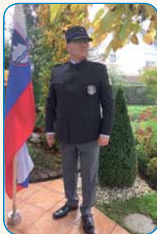
VEČ LET JE PREŽIVO NA TIHINSKOM stran 6