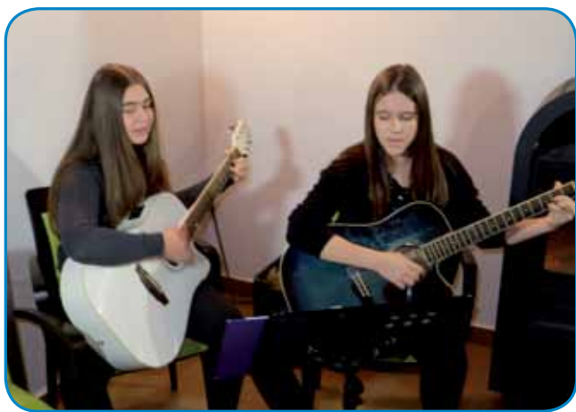
Učenci Zavoda Virtuoz iz Bodonec

Slovenski pravličari ali lidgé, šteri slovenske pripovejsti pripovedjajo, so 1. februara že šestič prišli v Porabje. Na prvi pet srečanaj na Gorenjom Seniki, v Števanovci pa Varaši smo zvekšoga čüli v domanjoj rejči pripovedjati knjižničarke s Prekmurja, bole djenau s Pokrajinske in študijske knjižnice Murska Sobota. Tisti programi so se zvali »Obujamo dediščino« ali »Prebidimo erbo« ino je bila njina soorganizatorka od leta 2017 Slovenska zveza.