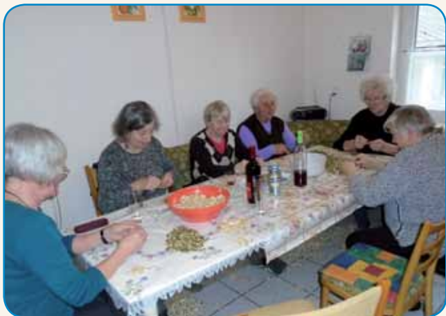
KAK JE INDA FAJN BILAU stran 5