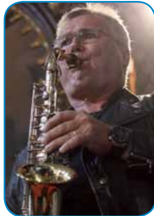
Saksofon je meu s sebov tüdi te, gda je živo na tihinskem

napravo kariero v policiji. Med drugim sam biu tüdi načelnik kriminalistične policije v Murski Soboti. Gda je Slovenija gratala svoj rosag, so me poslali za šest mesecov v Meriko, na FBI akademijo. Sledkar smo z držino živeli na Nizozemskom, v varaši Haag, vej pa