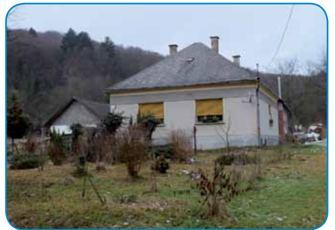
Ram na Gorenjom Seniki, gde zdaj Erzika sama živé

»Pa povejte, če je te nej baukša bilau kak zdaj, te so sodacke skrb meli na vse, še ognjov (požarov) nej bilau telko, zato ka so sodarcke v noči odli kauli po cejlj vesi pa so vse kaj tašo vidli. Prvin, gda je že meja bila, te je bola samo domanjo lüstvo odlo do meje, steri so tam grünt meli, zato ka vsikšo njivo so obdelali. Nej