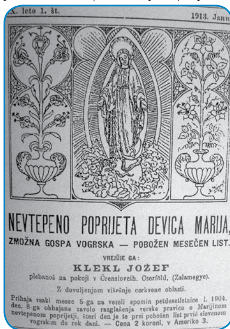
Do leta 1914 je vörski mejsječnik dugi naslov emo, depa vsi so ga zvali samo »Marijin list«