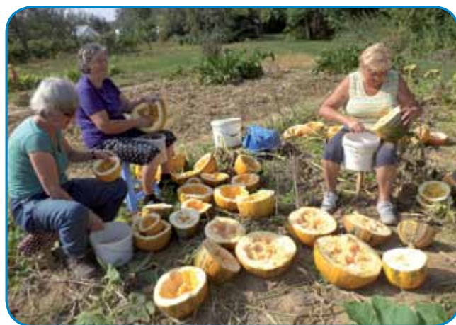
Ženske med pucanjem tikvi na njiivi, stero obdelujejo z arende

jo ali ne zbrignejo. Tau je leko bilau več pünklov tü. V zimi so pa vödelali olaj, no, tau je pa lejpo delo bilau. Vertinja brigo mejla kreda djasti dobro domanjo djesti, küjano šunko, krü, slivovo palinko. Vskša držina mejla zavolé olaja, najme-