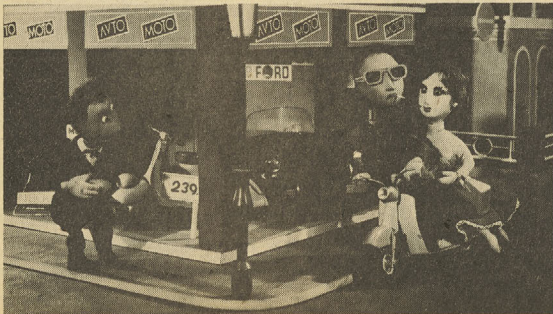
Prizor iz lutkovnega filma Saša Dobrila „MOTORITIS“

Samo po sebi se ponuja vprašanje: kako to, da je Walt Disney tri ali štiri desetletja obvladal risanke na taki vrhunski stopnji priljubljenosti, da je zasenčil tudi tiste mojstre novih