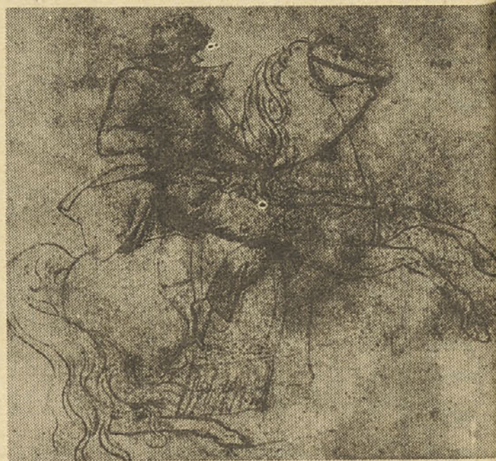
Mihael Stroj: „JEZDEC“ — 20. leta 19. stoletja; Narodna galerija Ljubljani