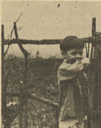
Dva izmed mladih v Pušči. Tudi za njiju dozidavajo vrtnice.

Šla sva po blatni stezici proti vasi in že naju je pozdravil pasji zbor. Psi so naju spremljali do naselja, kjer se jim je pridružil velik trop otrok. Previdno sva gazila po blatu. Na oknih je mgolelo ciganov. Obvesčevalci so dobro delali. Preden sva bila na koncu vasi, so že vsi vedeli,