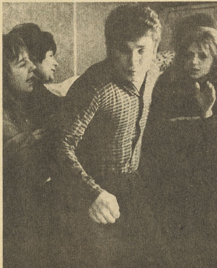
Film „Plavolaskine ljubezni“ je v liku glavne junakinje nakazal preizkušnje mladih ob prvem srečanju z erotiko in seksom

Spolnost in nasilje sta v filmu lažje tretiraju celotnih družbenih dognanj utemeljena, lahko pa tudi zlorabljena z vidika malomeščanskih stališč trgovine in določenih družbenih