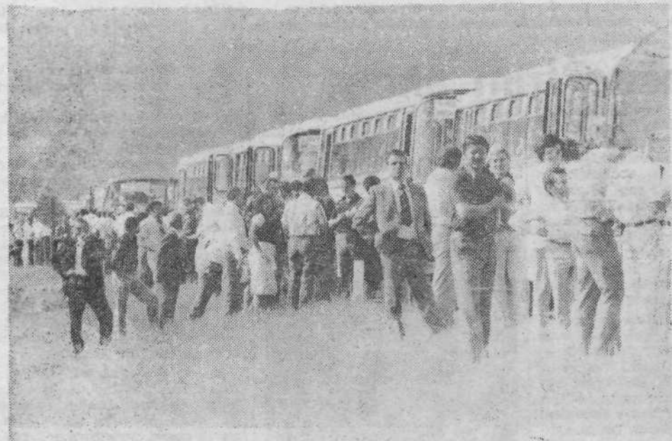
Triindvajset avtobusov s približno tisoč Rečani je to soboto pripeljalo v Ljubljano, na enajsto tradicionalno srečanje pobratenih mest.