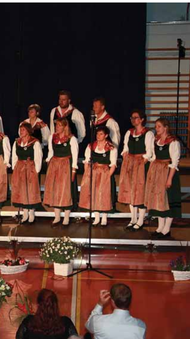
Pevsko srečanje „Od Pliberka do Traberka“ je edina oblika čezmejnega kulturnega sodelovanja s 50-letnim neprekinjenim sodelovanjem. MePZ Podjuna 2017.