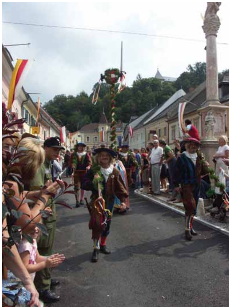
Letni sejem v Pliberku ima večstoletno tradicijo; 2010.

tekkel v goro, kjer spi, dokler se mu ne bo brada devetkrat ovila okoli mize. Njegovo prebujenje naj bi prineslo nov razcvet in napredek dolini. O Kralju Matjažu so ohranjene številne pripovedi, v Mitneku pa že tretje desetletje sredi zime gradijo snežne gradove.