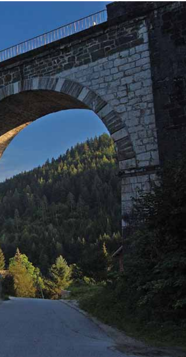
Štoparjev most, najznamenitejši kamniti most na Koroškem na železniški progi Celovec–Maribor, 2010.

V obdobje poznega srednjega veka sodijo tudi ohranjene sledi utrd, imenovane turške šance, grajenih za obrambo proti Turkom, ki so v tem prostoru pustošili v drugi polovici 15. stoletja. Protiturški obrambni sistem iz 15. stoletja v pasu od Preškega vrha proti dvorcu Javornik na Ravnah na Koroškem je varoval prehod med Štajersko in Koroško, obrambni sistem blizu Železne Kaple pa prehod med Kranjsko in Koroško.