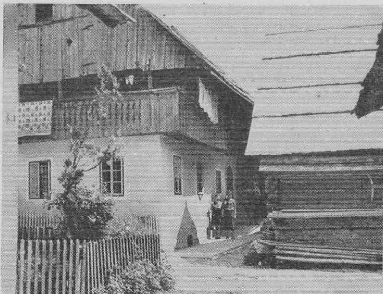
Hiša v Češnjici