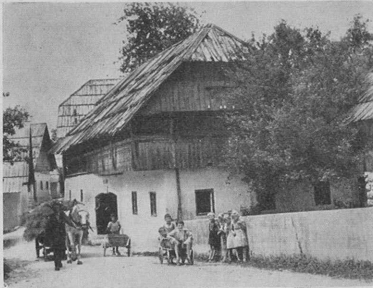
Stara kmečka hiša v Češnjici