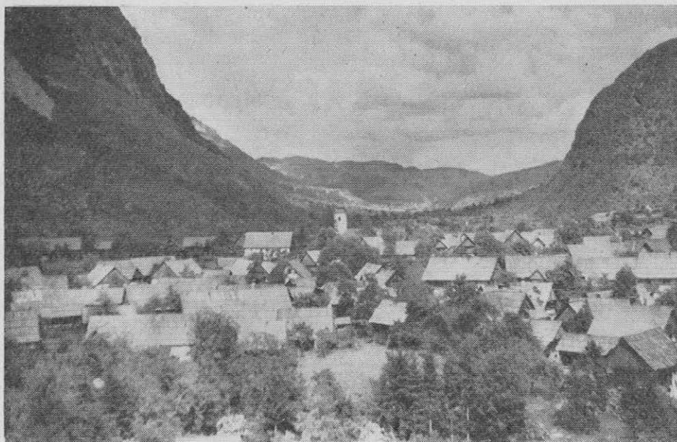
Srednja vas, v ozadju korito gornje Bohinjske doline, vzdolbeno od ledenikov