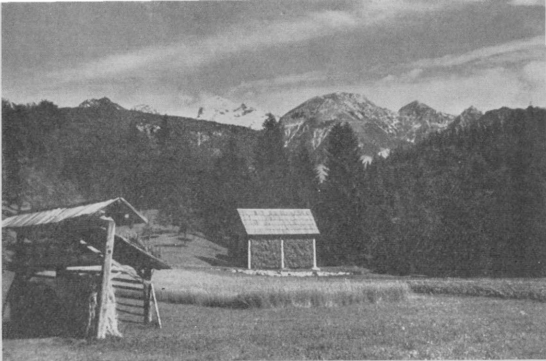
Zasneženi Triglav z Ribčevega laza – sredi julija 1959