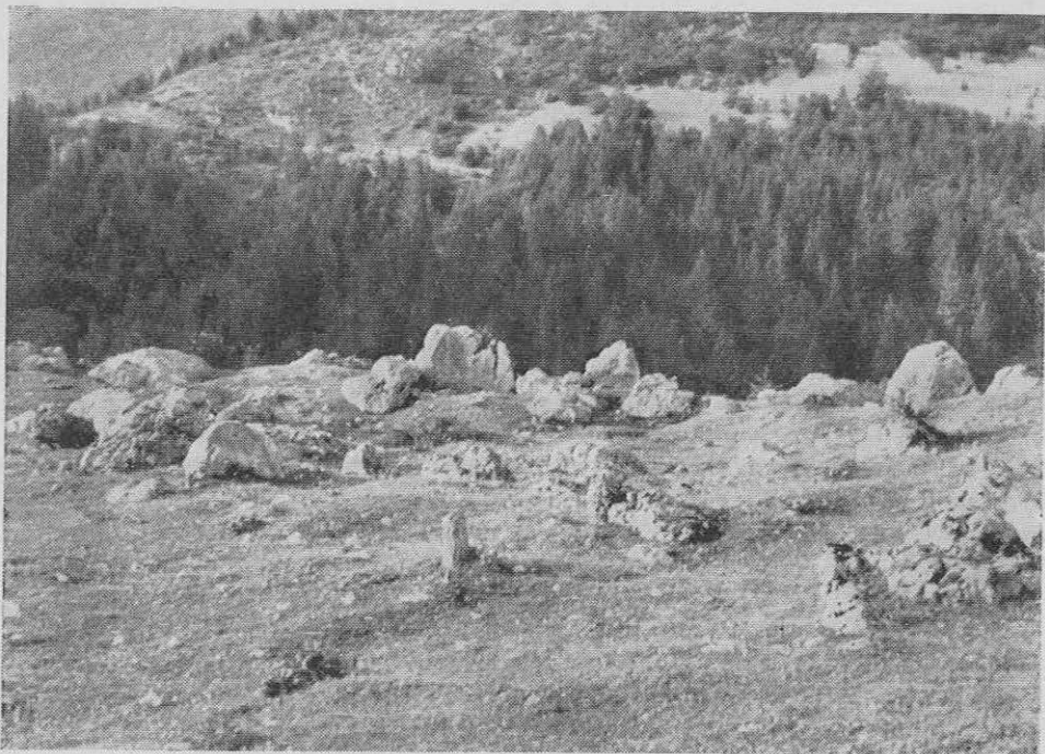
Ledeniška groblja nad Boh. jezerom