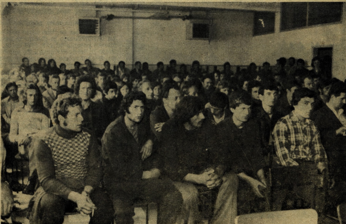
Delavci in delavke TOZD Tovarna kontejnerjev na zboru dne 3. 6. 1976

Sedaj je v izdelavi sanacijski program za tovarno kontejnerjev. Ta program bo treba skrbno in