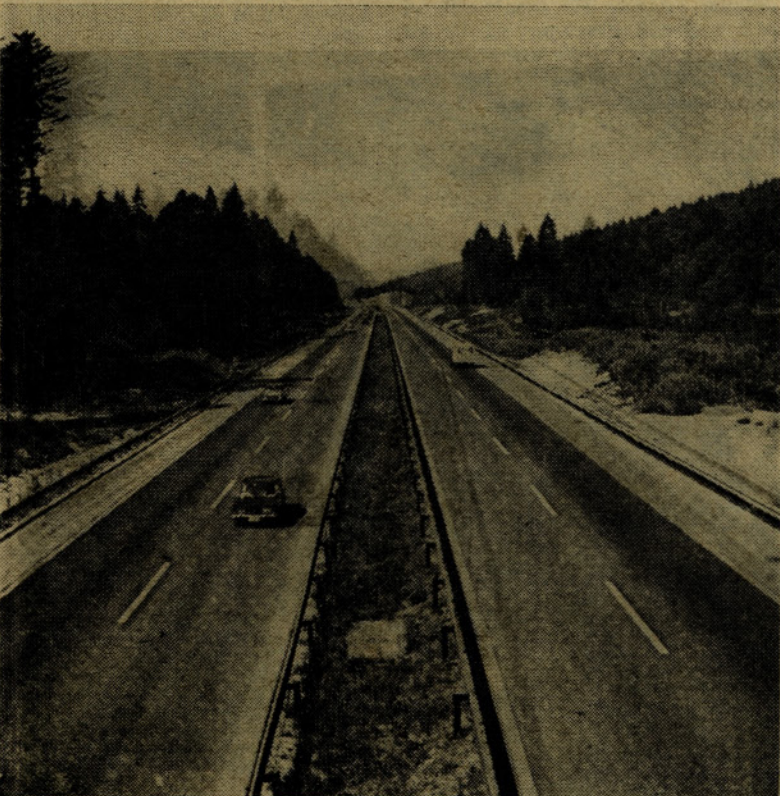
Lepa dežela, lepe ceste, dobro gospodarjenje

V skladu z resolucijo o družbenoekonomski politiki in razvoju Socialistične republike Slovenije ter neposrednih nalogah v letu 1976, ki jo je sprejela Skupščina Slovenije na svoji seji dne 29. decembra 1975 in je objavljena v Uradnem listu SR Slovenije, št. 29/75, je skupščina Republiške skupnosti za ceste SR Slovenije na svojem 9. rednem zasedanju 29. marca 1976 sprejela sklep, da Republiška skupnost za ceste SR Slovenije izda obveznice posojila za novogradnje, rekonstrukcije in modernizacije magistralnih in regionalnih cest v obdobju srednjeročnega plana 1976-1980 na območju Socialistične republike Slovenije.