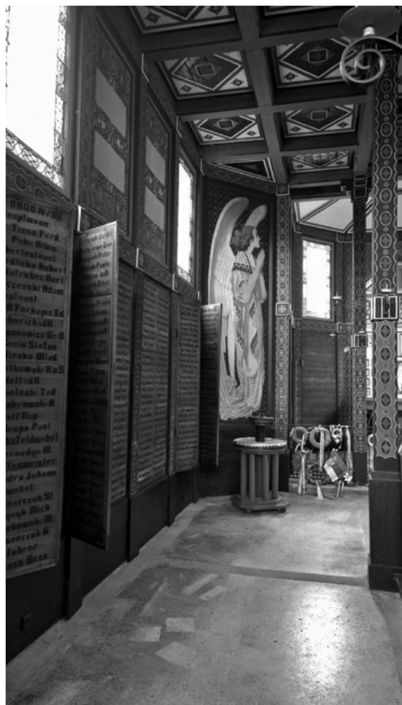
Cerkev Svetega Duha na Javorci.