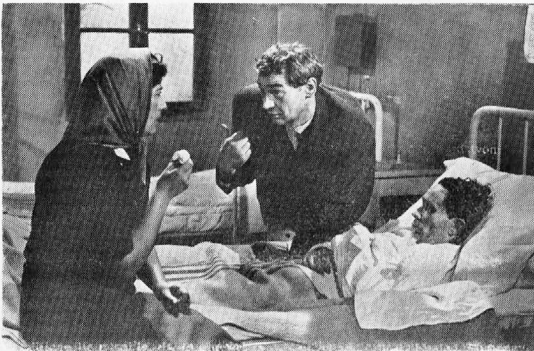
Prizor iz filma »Štiri kilometre na uro«, v katerem je prepričljivo zaživela atmosfera provincialnega mesteca pred tridesetimi leti