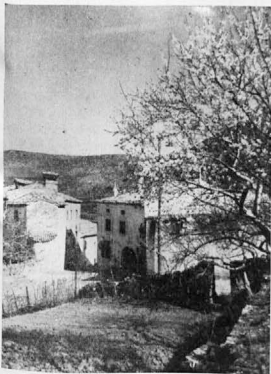
Dolina

Angleška industrija avtomobilov je zelo razvita, saj ima nič manj kot 17 tvornic, in sicer Aston Martin, Vauxvall, Morris, MG, Jaguar, Humber, Hillman, Ford, Bentley, Austin in Austin Healey, Rover, Singer, Standard, Sunbeam, Triumph in Rolls Royce. Najbolj luksuzni avtomobil je Rolls Royce, ki ima 6.230 kcm in stane 11 milijonov lir. Dobri avtomobili so tudi tisti znamke Austin, katere je začela izdelovati tudi italijanska tvornica Innocenti. Znani vozili sta nadalje Hillman »Minx« (1500 kcm) in mali Morris Mini Minor, ki stane samo 650.000 lir. Angleži nameravajo spraviti na tržišče tudi novo vozilo Herald S 1200 Triumph (1147 kcm).