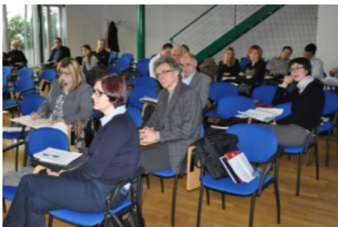
Udeleženci med delavnico o lobiranju

Komisija je v sodelovanju s Skupnostjo občin Slovenije organizirala seminar z delavnico »Pravila lobiranja na lokalni ravni«. InSTITUTE ZIntPK, še posebej tiste, ki so pomembni za delovanje lokalnih skupnosti, so udeležencem predstavili strokovnjaki s posameznih področij dela komisije. Praktični del seminarja je bil izveden v obliki delavnice, v kateri so sodelujoči na konkretnih primerih poglobljali svoje znanje s področja lobiranja.