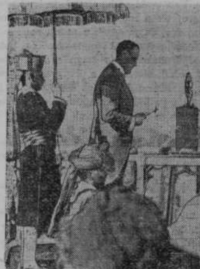
Indijski podkralj, angleški lord Linlithgoro, govori indijskim voditeljem, kateri zahtevajo, da postane Indija angleški dominijon po zgledu Avstralije, Kanade itd.