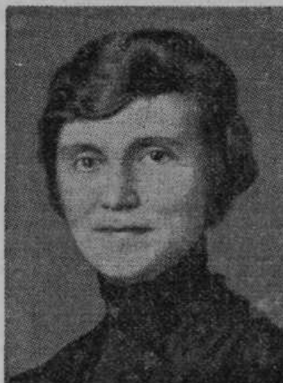
Bivša avstro-ogrška cesarica Zita, o kateri potrjujejo vesti, da bo postal njen sin Oton vladar po tej vojni na novo vzpostavljene Avstrije

Kaj čakate? Ali hočete zopet naročiti cenik šele potem, ko bo istega zmanjkalo. Pišite še danes trgovski hiši Stermecki, Celje po novi cenik in vzorce. 1573