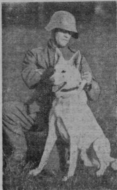
Armada v Švici se poslužuje psov za prenašanje povelj od ene do druge edinice