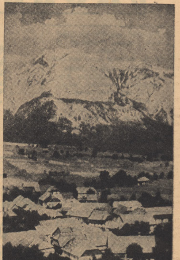
DREVLJE V ZILJSKI DOLINI.