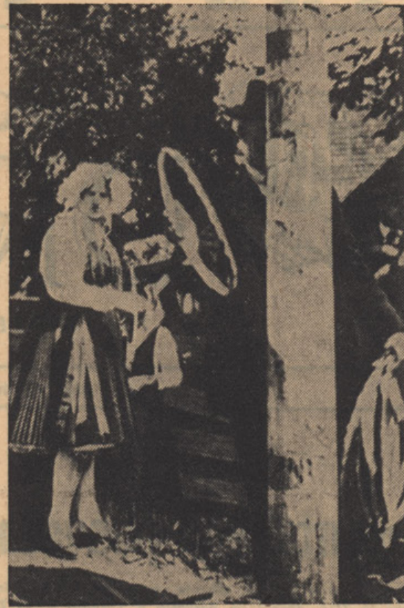
DEKLE Z „VENCEM“ — NAGRADO ZA ZMAGOVALCA PRI ŠTEHVANJU.

V soboto pred žegnano nedeljo postavijo „stebber“. To je drog v debelini telegrafskega droga. Stebber moli 3 m iz zemlje. 60 cm od vrha je zožen, da se more nanj nataktni sodec. 60 cm globoko je stebber zakopan v zemljo. Dno in pokrov sodca imata na sredi luknjo, da se more sodec nataktni na