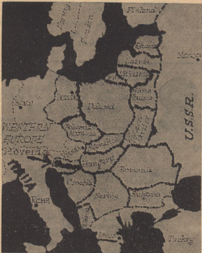
RAZTEGNITEV „ŽELEZNE ZAVESE“ V OSRČJE EVROPE.

vojno in po njej zemljepisno karto Evrope, na kateri je Slovenija posebej označena. Enako tudi Hrvatska in Srbija.