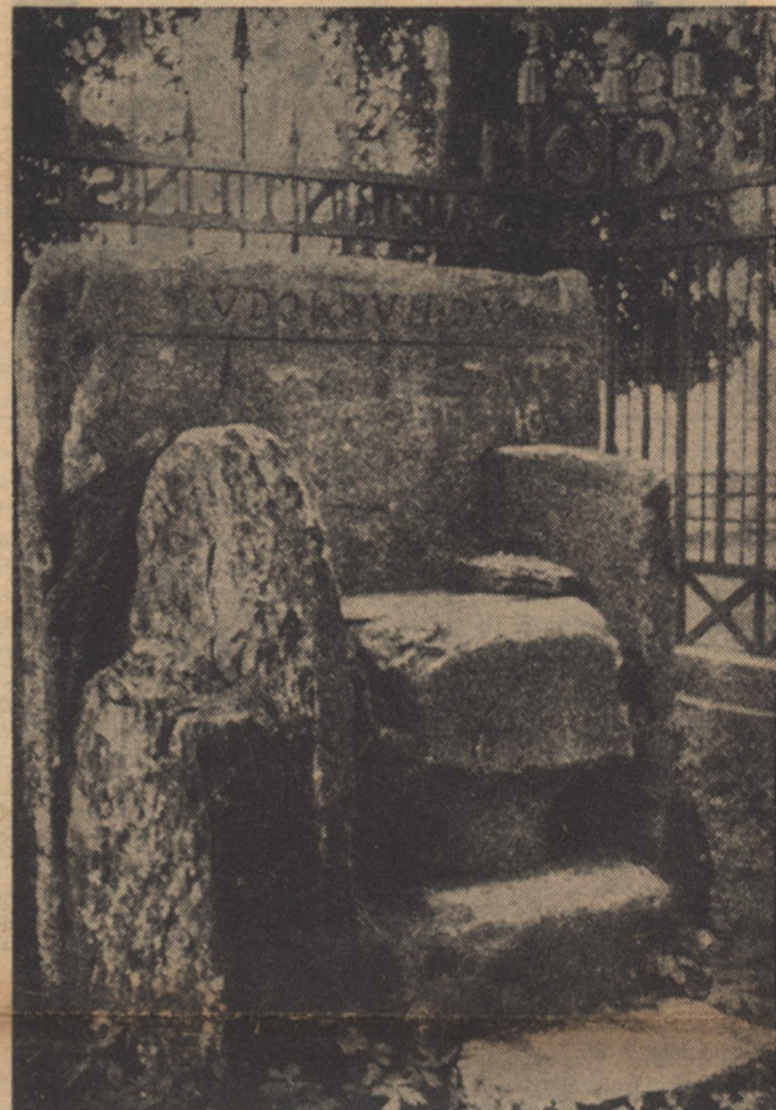
IN THE ZOLLFELD, NEAR MARIA-SAAL, STANDS THE DUKES THRONE . . . — NA GOSPOSVETSKEM POLJU VOJVODSKI PRESTOL STOJI . . .

... Many of these Slovenian farm cottages, as well as some Slovenian city homes, still mark off a corner of one of the main rooms as a „Bogkov kot“ or God's Corner. Here they hang a religious painting, or keep a small statuette the year round, for family prayer and „getting the children used the idea of Church, God, Christ“.