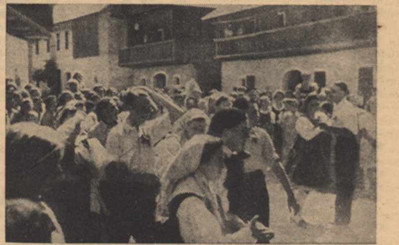
„REJ“ POD LIPU V BISTRICI NA ZILJI.