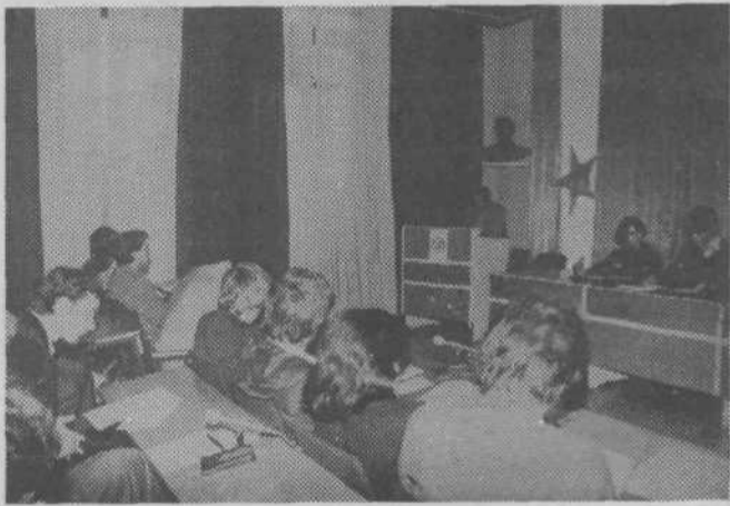
Delovni posnetek z izredne konference mladih

Z delom v osnovnih organizacijah je šlo počasi, a zanesljivo navzdol, področne konferencie niso prav zaživele in tudi ne našle svoje vloge, tako da se je predsedstvo odločilo, da skliče izredno volilno programsko konferenco. Če lahko sodimo po ude-