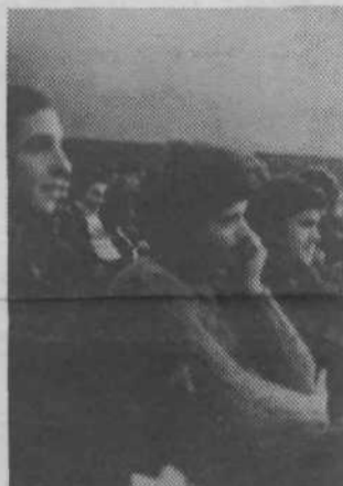
Občinska konferenca je pripravila, v sodelovanju s sekretariatom za narodno obrambo pri občinski skupščini, srečanje nabornikov-obveznikov. To srečanje naj bi postalo v prihodnje tradicionalno.

Na prvi seji predsedstva so se člani dogovorili za enodnevni delovni seminar, kjer naj bi pripravili in uskladili akcijske programe in rokovnike za delo komisij, klubov in področnih konferenc. Poudoben seminar naj bi bil tudi za vse predsednike osnovnih organizacij. IG