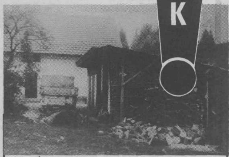
Pred nedavnim smo imeli člani KO ZB NOV Sostro-Podlipoglav v spominskem domu II. grupe odredov redno sejo. Bil pa sem krepko razočaran nad okolico doma. Za stavbo je sicer predvidena sanacija, toda leta najbrž ne bo odpravila navlake okoli hiše. Obupna je predvsem z zadnje strani. Na dvorišču stoji star zarjavel kombi, vse naokoli so razmetana drva in pločevina, drvavnice so iz raznih obdobij, zajčnice in odvržene stare pločevinke kaze okolico. Fotografija je bila posneta 17. oktobra.