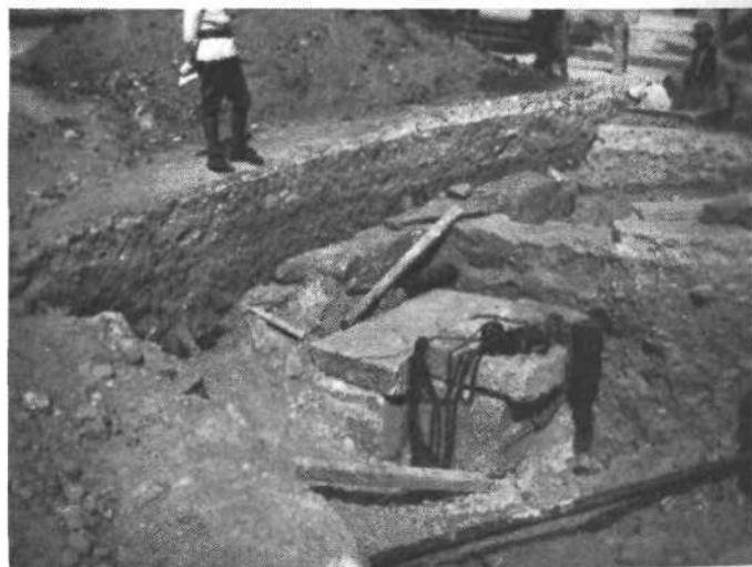
Rimska grobova pod cestiščem Groharjeve ulice v Ljubljani