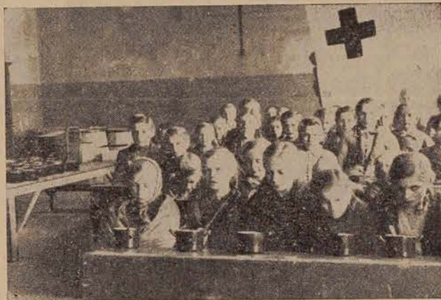
Solske kuhinje — za naše malčke potrebne in koristne ustanove

V našem okraju je silno potrebna in nujna borba proti tuberkulozi, saj boleha na tej bolezni skoraj vsak 65. človek v okraju ali 1,5 odst. vsega prebivalstva. Če k temu dodamo, da trenutno v okraju nimamo nobenega fiziologa in zato dispanzer v M. Soboti ne deluje, v Lendavo pa prihaja zdrav-