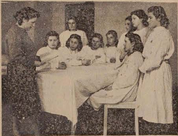
Na zdravstvenem tečaju — pri praktičnem delu

Komisija, ki je skrbela za organiziranje tečajev, je ustanovila 15 postaj za prvo pomoč, pri vaških odborih in v vseh šolah pa higienske koticke.