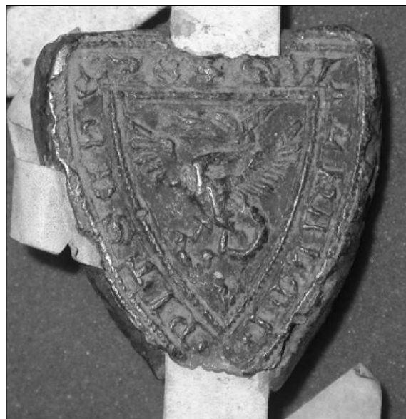
Večat l Ujema Višeškega na listini 1322 dec. 28., -1RJ, ZL 78.