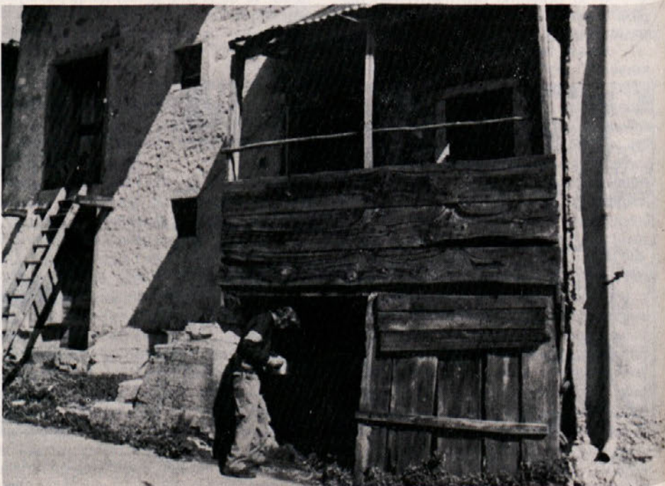
Beneška Slovenija: Oblica - stara hiša