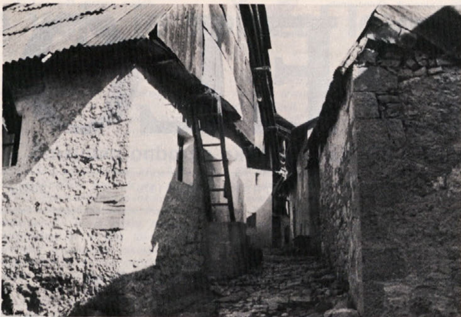
Beneška Slovenija: Debenje - med hišami

S tem bi torej problem teritorialnosti naše zaščite moral odpasti. V resnici pa je nasprotnikom globalne zaščite v vladni komisiji to služilo za nekakšno tezo o "vindišarstvu" nekaterih Slovencev, češ "objektivno" so Slovenci, videti pa je treba, ali se strinjajo z zaščito. Argument je sila šibel, saj bi bil v Italiji pravi zakonodajni kaos, če bi o vsakem zakonu preverjali, ali se prav vsi, do zadnjega, strinjajo z normativo, ki jo je odobril parlament. Pa niti za to ne gre. Znano je namreč, da italijanski politični sistem predvideva referendume o odpravljanju zakonov, izrecno pa prepoveduje referendume o temah, ki jih programsko določa ustava. Prav zaščita manjšina pa je ena izmed teh tem in je torej nikakor ni mogoče preverjati. Zaščitni zakon mora biti "na razpolago", torej namenjen vsem,