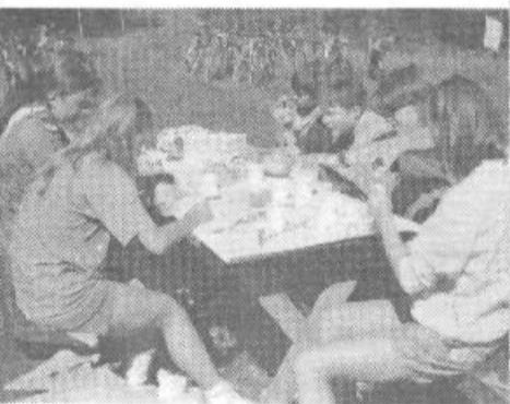
Ustvarjalne delavnice na stegu so spodbujale tudi likovno domiselnost