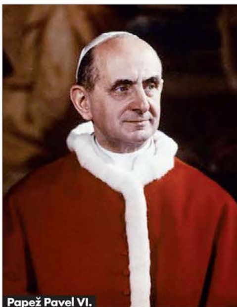
Papež Pavel VI.

riti, kar sem zatrdil glede koncilne nekaj mesecev po svoji izvolitvi za Petrovega naslednika: “Če ga beremo in sprejemamo v luči ustrezne hermenevtike, lahko