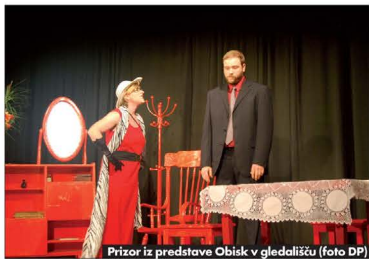
Prizor iz predstave Obisk v gledališču

pozdravnih besedah pred začetkom predstave. Amaterska gledališka skupina KUD Dolomiti Dobrova je l. 2003 oživila nek-