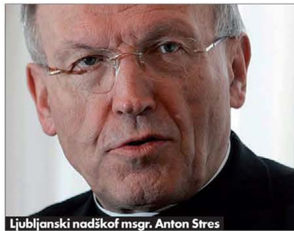
Ljubljanski nadškof msgr. Anton Stres

... Vsem, ki ste mi stali ob strani, se iz srca zahvaljujem: sestram klarisam in karmeličankam, drugim redovnicam, sobratom duhovnikom in vernemu ljudstvu. Hvala vsem, ki ste mi javno ali zasebno izrekli svojo podporo, papežu Benediktu XVI., kardina-