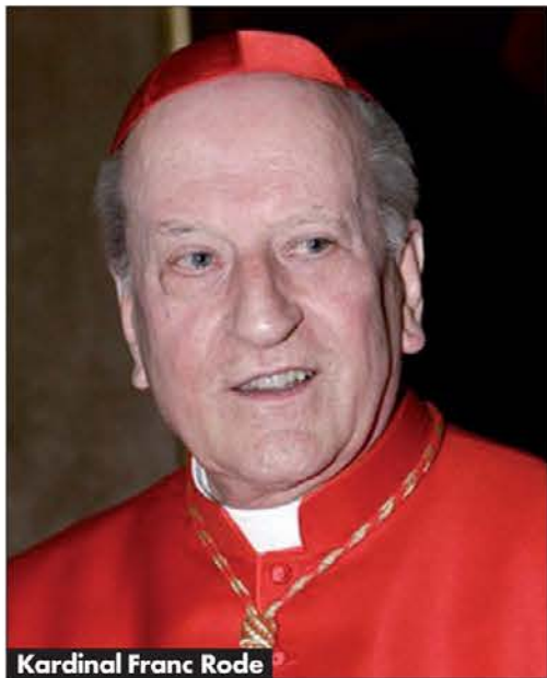
Kardinal Franc Rode