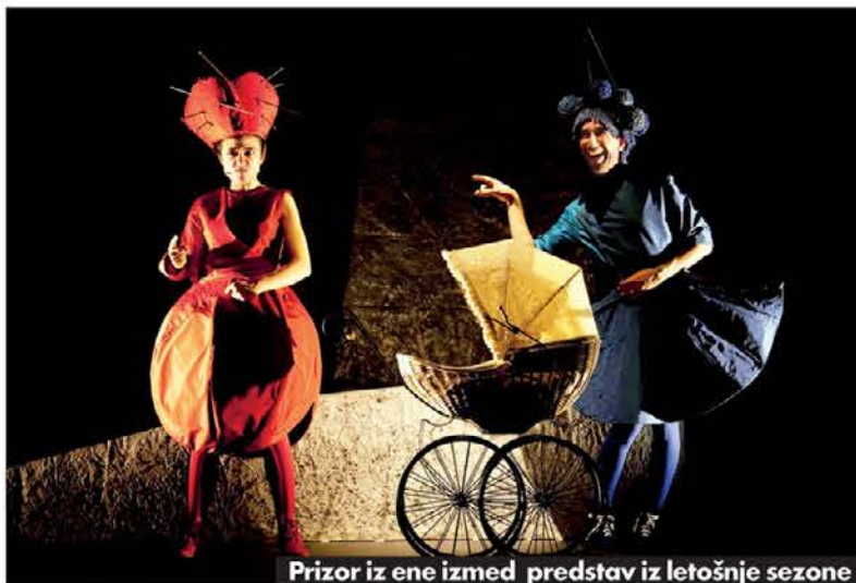
Prizor iz ene izmed predstav iz letošnje sezone

zoril predstavo Canzoncine alte così , s petnajstimi otroškimi pesmicami. Sledile si bodo predstave: otroški muzikal Io, tu