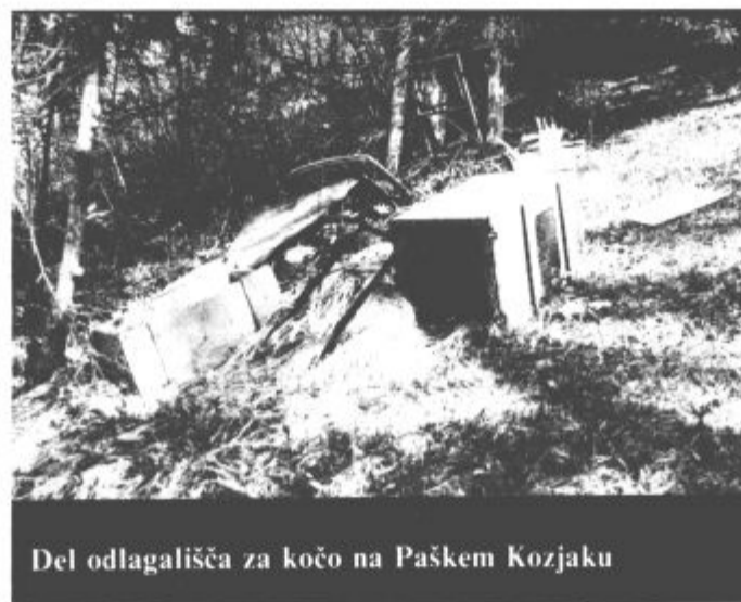
Del odlagališča za kočjo na Paškem Kozjaku

Takšne pridobitve so v zadnjih časih v naši občini redke, zato je v Cirkovcah tisti terek bilo še posebej veselo. (vos)