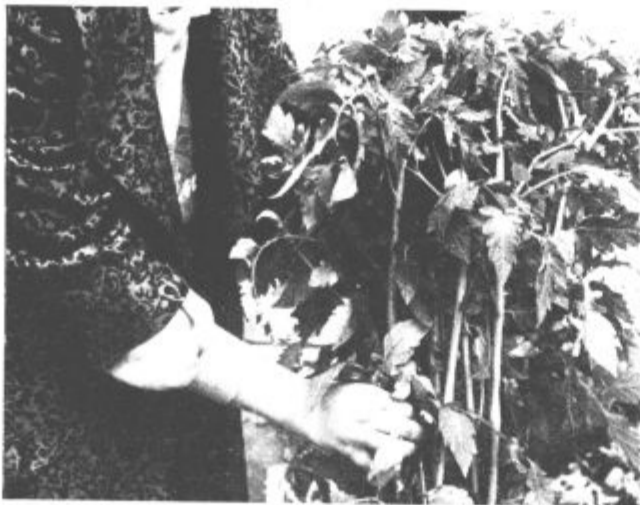
Kvalitetne sadike — dober pridelek

Upam dragi vrtičkarji, da boste med temi sortami našli primerno tudi za svoj vrtiček. Pred nakupom se prepričajte, če je rastlina zdrava in v dobri kondiciji, nikar pa vas naj ne moti, če je rastlina nekoliko višja. To uredimo s tem, da jo v zemljo položimo oziroma pogrobimo. S tem bomo vzgojili še bolj rastoče rastline, saj bodo korenine pognale po tistem delu stebra, ki je v zemlji. Želim vam obilen pridelek in užitek ob dozorevanju plodov.