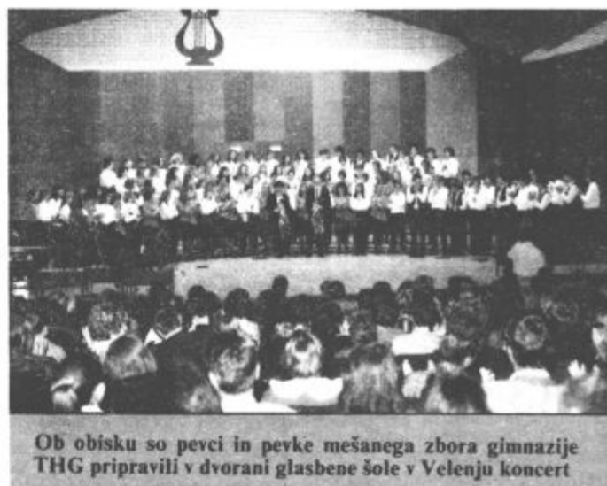
Ob obisku so pevci in pevke mešanega zbora gimnazije THG pripravili v dvorani glasbene šole v Velenju koncert

Slovo od velenjskih vrstnikov — prejšnjo soboto zjutraj — ni bilo prijetno, spet pa ne tako žalostno, kot bi kdo pričakoval. Temu je gotovo botrovalo dejstvo, da bosta dve leti, ko bodo v Esslingenu gostovali Velenjčani, tokrat po daljši varianti (štiri dni), hitro minili.