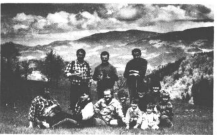
Utrinek s Šaleške planinske poti.