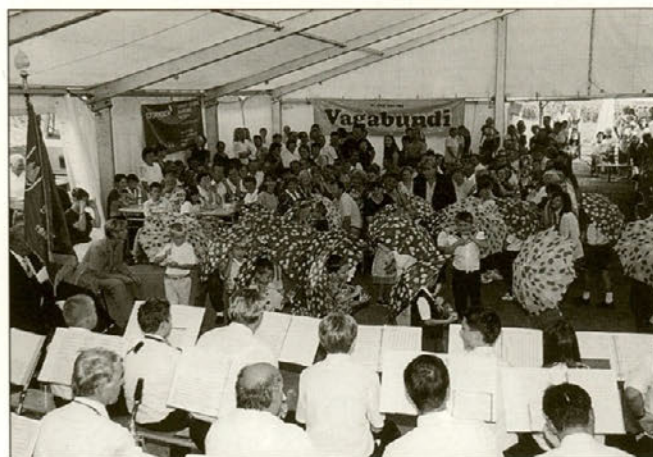
Čeprav je bila pokrajina obsijana s soncem, so malčki zaplesali Ples v dežju.