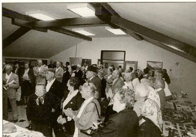
Po prihodu iz cerkve, so si občani ogledali pripravljeno razstavo.

Sledil je družabni del, začinjjen s "pekovo župo", ki je ob takih priložnostih še posebej dobro pripravljena in okusna. Da se je jezik sproščeno vrtel, pa je pripomogla dobra kapljica, zasladjena s pecivom skrbnih članic Župnijske karitas in njihovih pomočnic. Kar nekaj dela je bilo, skrbi in priprav. Ob stalni zasedbi članov Župnijske karitas so letos sodelovali člani Mlade župnijske karitas in pa člani KUD Majšperk. Ni kaj, druženje je bilo prijetno, več kot 250 starejših se je udeležilo srečanja. Gre pa zahvala vsem sodelujočim, ki so kakorkoli pripomogli k temu dogodku, posebej še Osnovni