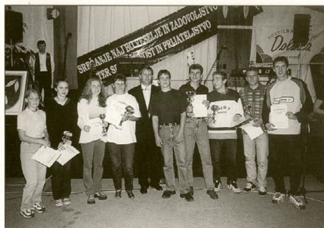
Tudi tenisačem so bili podeljeni pokali.