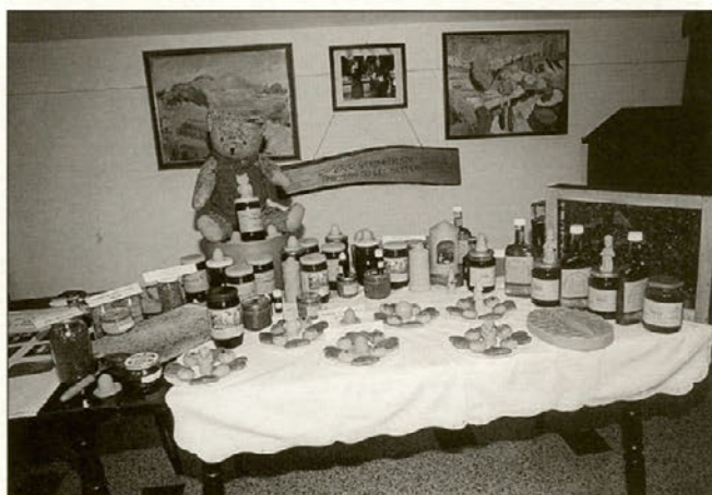
Čebelarji se radi pohvalijo s čebelami, njihove gospodinjje pa rade pripravljajo peciva iz medu.

Čebelarji pa so prikazali panj s čebelami, pridelan med in ostale medene izdelke.