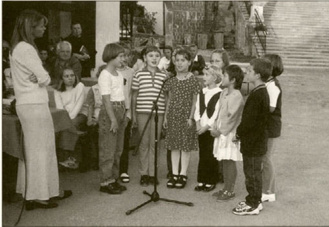
Osnovnošolci s Ptujске Gore so s pesmijo pozdravili vse prisotne na otvoritvi.

Oporni zid na Ptujski Gori je bil poškodovan po neurju v lanskem letu. Dolžina opornega zidu je 60 metrov. V najvišji