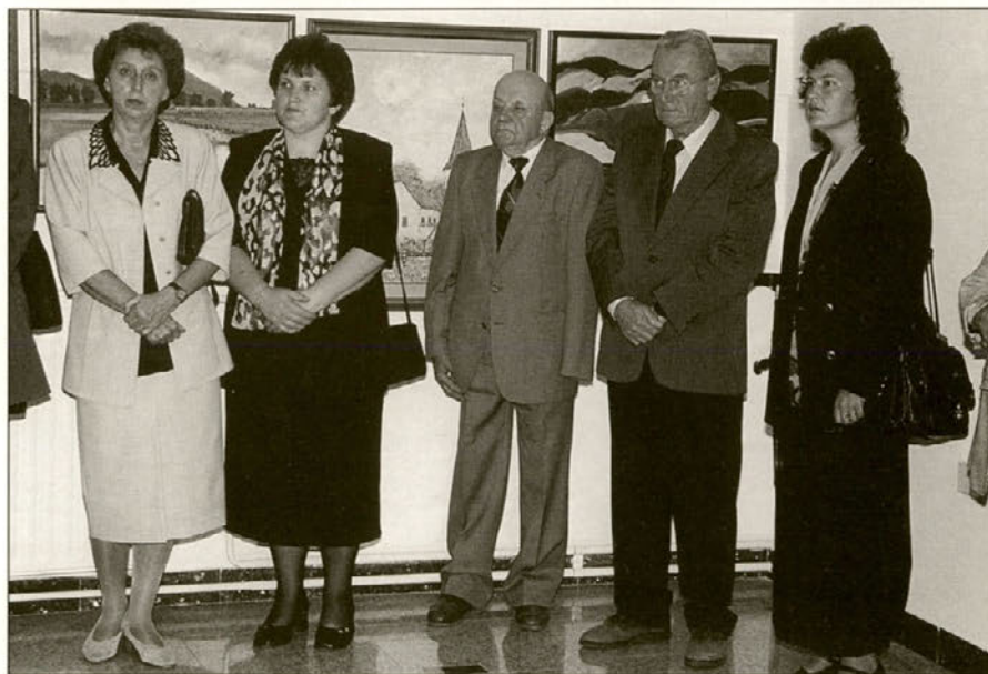
Svečane seje so se udeležili tudi dobitniki priznanj in plakete.