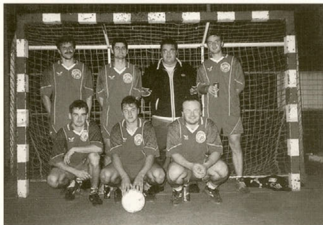
Zmagovita ekipa pred nogometnim golom.