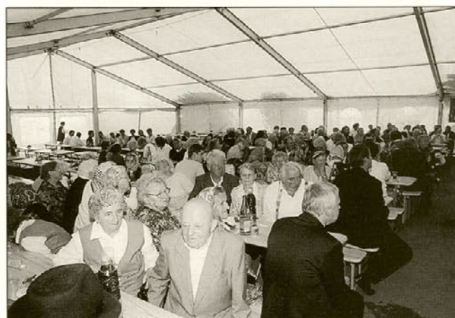
Zbrali so se starejši, ki so se po končani proslavi, namenjeni njim, spustili v prijeten pogovor.

šoli Majšperk, ki je ob sodelovanju posodila ozvočenje in tako omogočila, da so tudi "naglušni" kaj slišali.