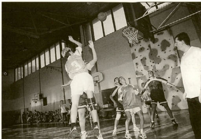
"Bo ali ne bo koš," so se vpraševali tekmovalci pod košem.

Le tri dni pred zaključkom občinskega praznovanja, torej v petek, so se v šolski telovadnici pomerili košarkarji. Odigranih je bilo osem tekem, sodelovali pa so športniki iz osmih športnih društev. Najbolj razigrani so bili košarkarji Športnega društva Majšperk I. V zmagah pa so le nekoliko zaostajali športniki Športnega društva Majšperk II in Športnega društva Breg.