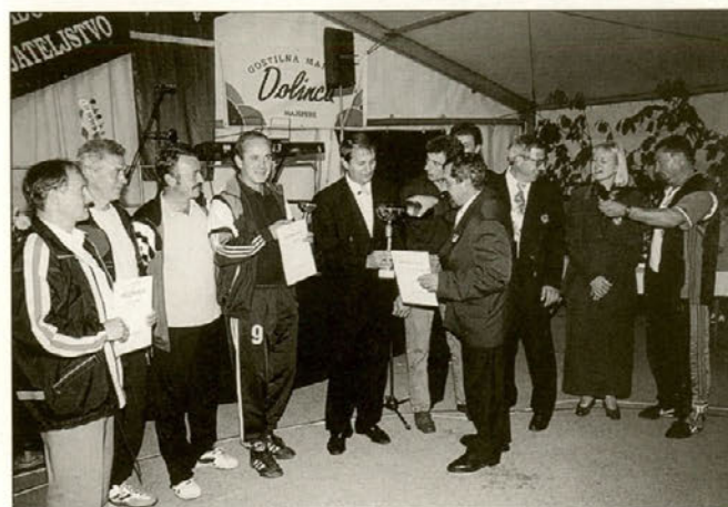
Tudi občinski funkcionarji so prejeli pokal.