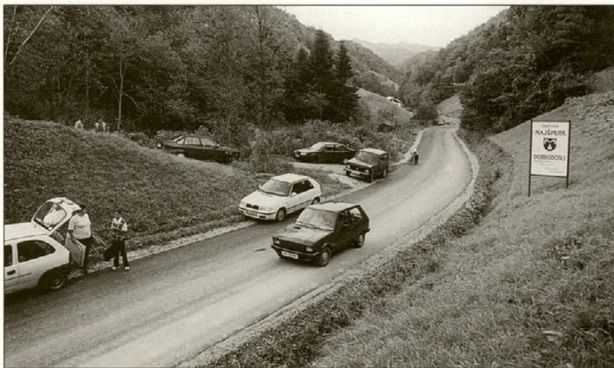
Prah je končno zamenjal asfalt.