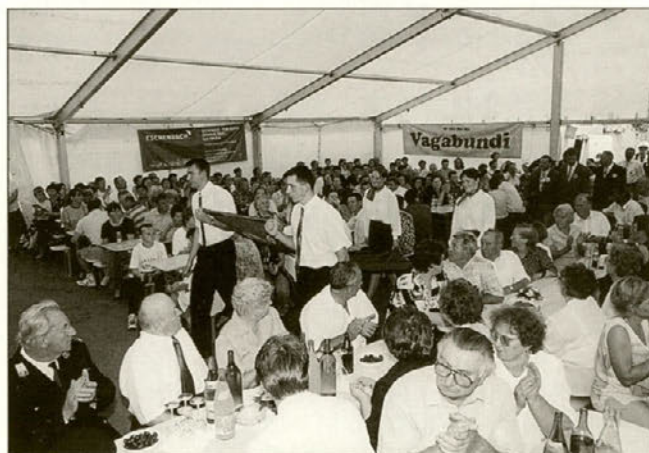
Zastavo so prinesli mladi iz Majšperka.

V kulturni program so se vključili tudi naši najmlajši. Vzgojiteljice in otroci iz majšperskega vrtca so predstavili PLES Z DEŽNIKI , čeprav je zunaj sijalo sonce.