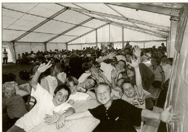
Lepo je videti veselega in nasmeganega otroka. Da bi le bili takšni vsi otroci, saj ti prinašajo smeh v naše domove.