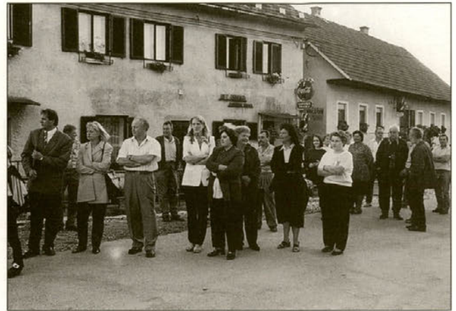
Kar nekaj občank in občanov se je udeležilo otvoritve.

točki meri kar 7,5 metra. Obnovitvena dela so se opravljala v času od 15. avgusta do 20. oktobra 1999. Dela je opravilo podjetje ŠTAJERGRADING d.o.o. iz Ptujja in Občina Majšperk z delavci, vključenimi preko javnih del.