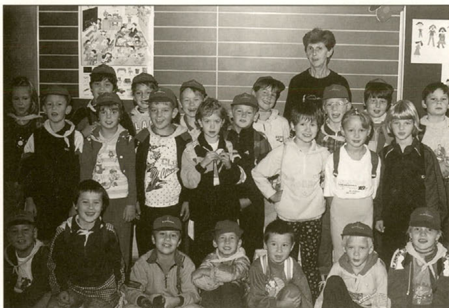
Prvošolčki skupaj z razredničarko.