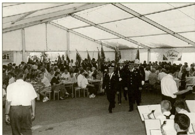
Pričetek proslave je označil prihod praporščakov.

V pozdrav vsem dobitnikom občinskih priznanj in dobitnici plakete Občine Majšperk je voditeljica spregovorila tako: "Majšperska občina je s svojimi kraji in zaselki v ponos vsem tistim, ki so v preteklosti in v sedanosti vgrajevali kamenček v mozaik njene lepe podobe ter tako utrjevali temelje njene prihodnosti. V vsakem obdobju je območje Občine Majšperk dajalo priložnost, da svoj dar prav na tem mestu in v teh krajih izkažejo – v vsej svoji širini različni snovalci in ustvarjalci, pa naj bodo znanstveniki, umetniki, gospodarstveniki, delavci ali kmetje, ali interesna in druga združenja.