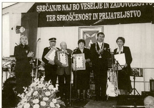
Dobitniki priznanj skupaj z županom in podžupanjo občine.

sodeloval pri pridobivanju članov v članstvo Rdečega križa in članov za izobraževanje na področju prve medicinske pomoči.