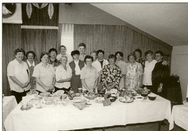
Gospodinjje so pripravile veliko jedil, med katere spada tudi zelenjavna prehrana.