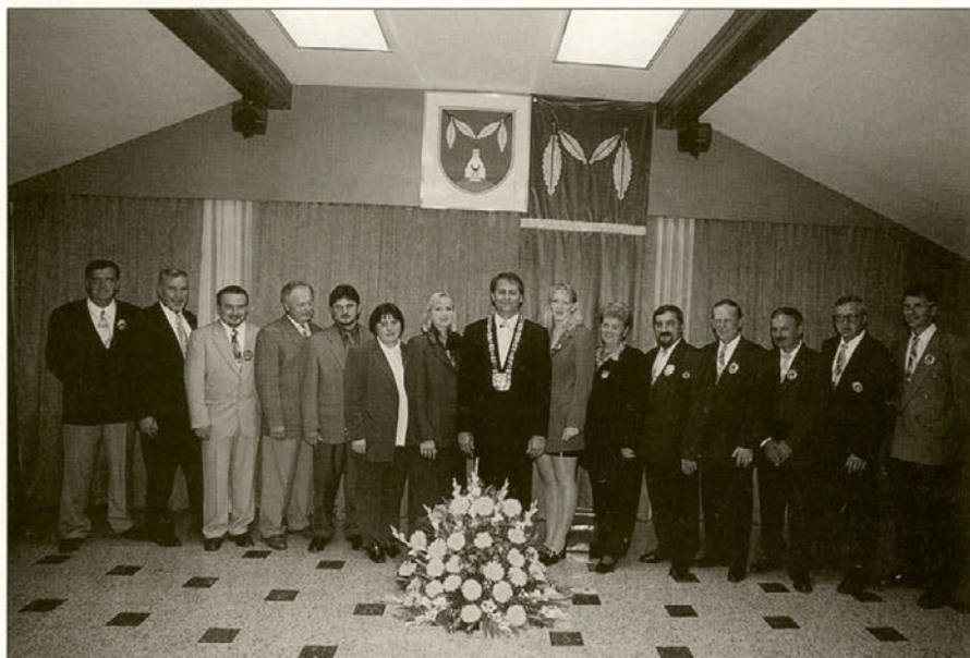
Na svečani seji so bili prisotni vsi svetniki in svetnice.