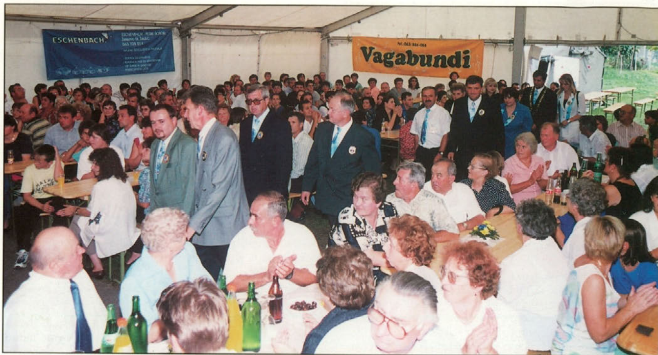
Prihod svetnikov v šotor so z aplavzom pozdravili vsi prisotni na prireditvi.