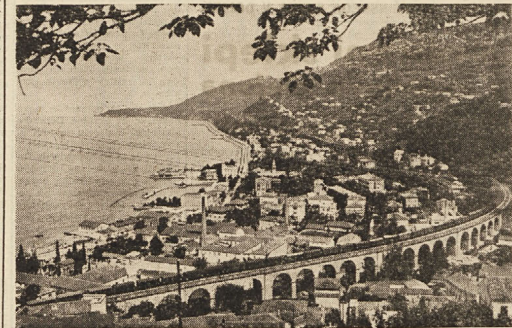
Pogled na barkovljanski del tržaške obale, ki ni zadostno izkoriščena za graditev kopaljšč. Ta del obale je eden najlepših in najbližjih okolici Trsta, zato pa bi se morali upravitelji zanimati, da bi ga pravilno izkoristili, kar bi nedvomno služilo prebivalstvu in povečanju turistične vrednosti našega mesta.