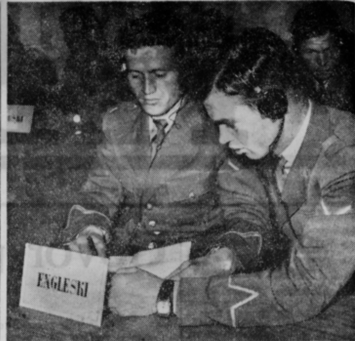
Med šolanjem se gojenci vaških šol poleg strokovnega izobraževanja izpopolnjujejo tudi v znanju jezikov. Zato imajo na razpolago najsodobnejše pripomočke, magnetofone in druga tehnična sredstva

Člani sindikalne podružnice pri OBLU Ormož so na nedavnem sestanku sklenili, da bodo v letošnjem septembru odšli na avtobusni izlet na relaciji Ormož—Ljubljana—Koper—Nova Gorica—Kranjska gora—Bled—Ljubljana—Ormož. Prav tako so sklenili, da naj podružnica nabavi weekend hišico in jo za potrebe članov podružnice postavi v Selcah pri Crikvenici. Na sestanku sindikata je bilo tudi govora o prostovoljnem delu, katerega bi se naj udeležili člani podružnice v mestni grabi pri urejanju telovadnice. PZ