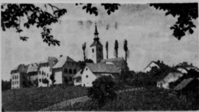
Pogled na Desternik z vzhodne strani

V nedeljo, 28. maja 1961, je bilo v dvorani zadrudnega doma pri Lovrencu na Dravskem polju razvite novega pionirskega prapora. Starešinstvo pionirskega odreda v Lovrencu je povabilo na pionirsko slovesnost tov. Vido Tomšičevo, ki se je pionirjem