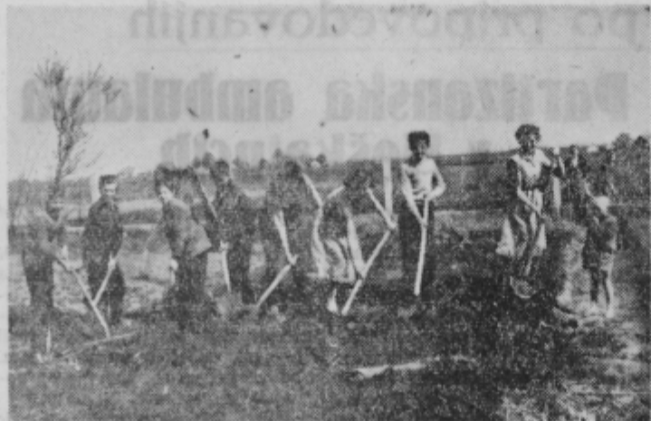
Članstvo zadruge med delom na vrtu

Od 9. februarja 1959 obstaja v Cirkovcih šolska zadruga s 180 člani in članicami — učenci osnovne šole s 18 a vrta in 29 a njive ter stanovanjsko hišo. Uspešno delo te zadruge priznava trg. podjetje »Vrtnina« Trbovlje, ki odkupuje od zadruge pridelke, nadalje kmetovalci iz Cirkovc in iz sosednih vasi, ki jih zalaga zadruga z različnimi kvalitetnimi sadikami, priznavajo pa jih tudi starši otrok, ki vidijo, da se učijo otroci skrbnega obdelovanja zemlje, pridelovanja kvalitetnega pridelka in skupnega gospodarjenja s pridobitnim sredstvi.