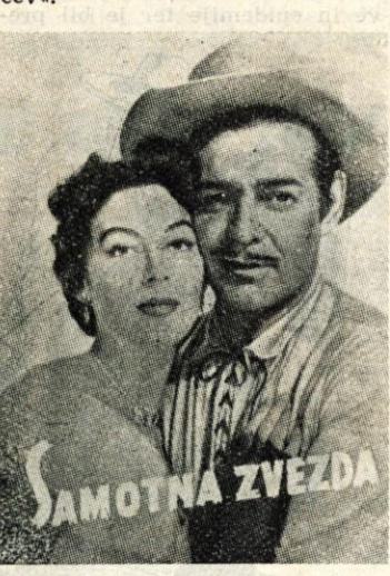
Ava Gardner in Clark Gable v amer. filmu »Samotna zvezda«

Uprava za ceste LRS, tehnična sekcija Ljubljana, Cestno nadzorstvo Kranj, razpisuje za dne 19. marca 1954 licitacijo za razvoz gramoza, za področje Cestnega nadzorstva Kranj v letu 1954.