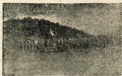
Zapisegi novih borcev Kokrškega odreda