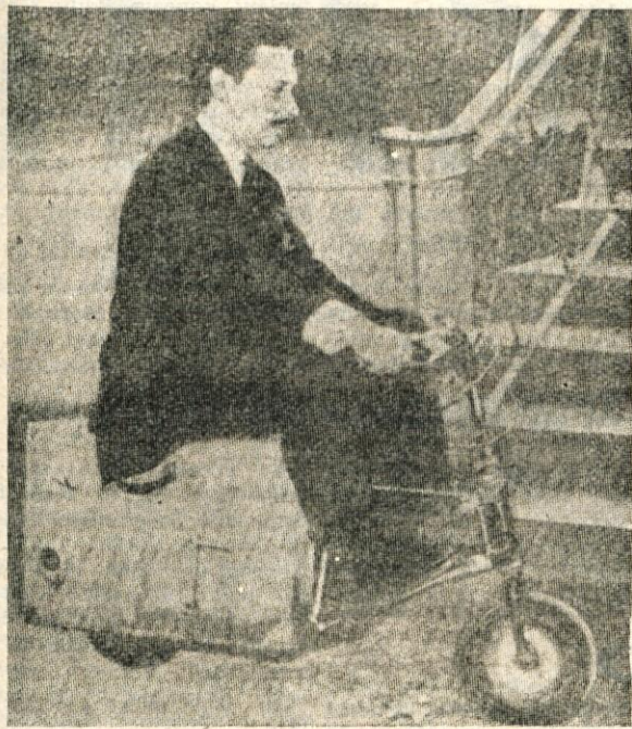
MOTORNO KOLO V KOVČKU

Na velesjemu v Frankfurtu je vzbujalo posebno pozornost motorno kolo, ki so ga izdelali v Franciji. Motor se sestavi iz posameznih delov, ki so shranjeni v kovčku. Motorno kolo je težko okoli 40 kilogramov, motor pa ima 100 kubičnih centimetrov. Najvišja hitrost, ki jo lahko to vozilo doseže, je 70 kilometrov na uro.