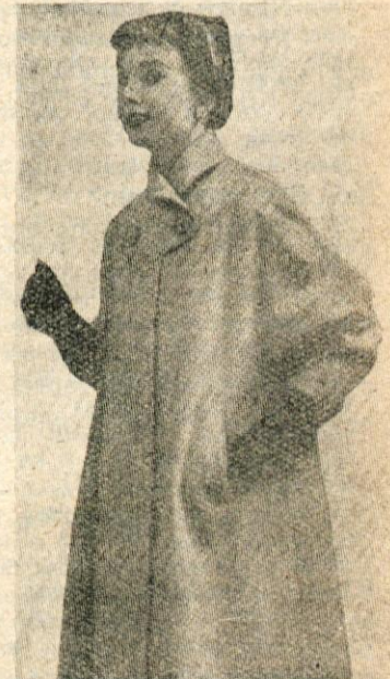
Spomladanski plašč za mlada dekleta

Zdaj, ko imamo že dovolj strokovnih knjig in brošur o negi dojenčka, res ni več potrebno, da delajo naše žene take napake.