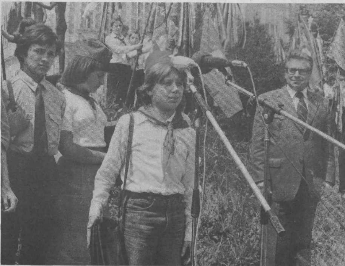
S prireditve ob zaključku letošnje »Kurirčkove pošte« v Tivoliju

spevek k varstvu človekovega okolja in vrnitev industriji potrebne surovine.