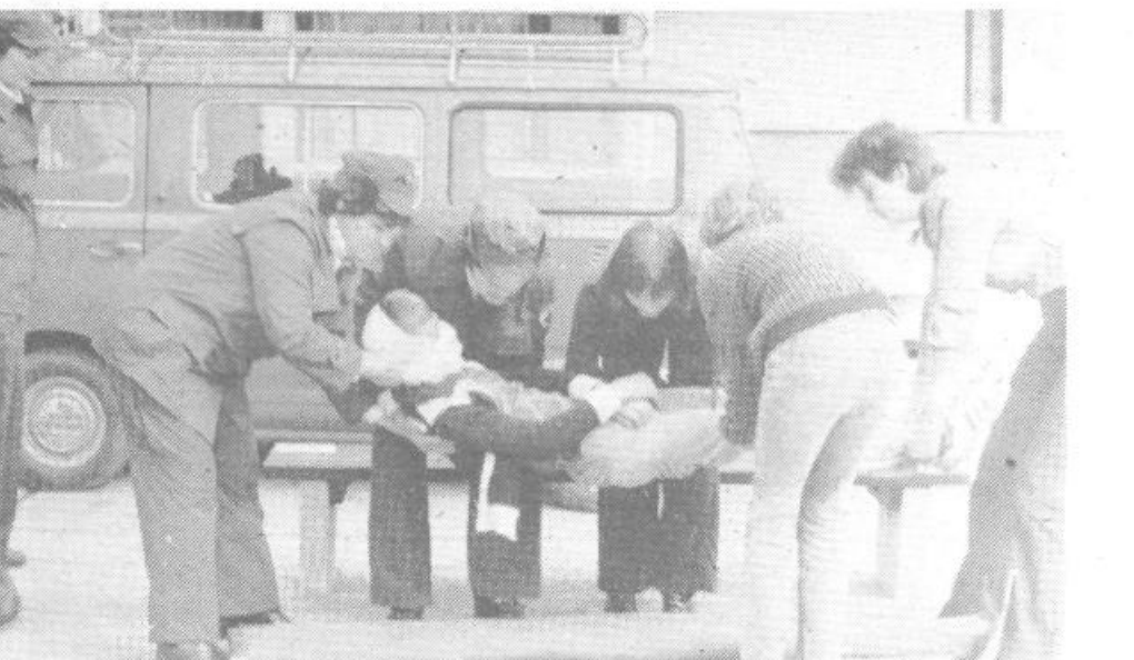
Ekipa prve pomoči so nemudoma ukrepale. Na posnetku – polaganje ranjenca s težjimi poškodbami na nosilo.