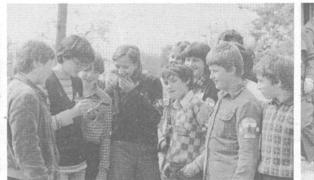
Najmlajši krajan Brezovice pri poročanju o svojih ugotovitvah, ki so jih prinesli s terena.