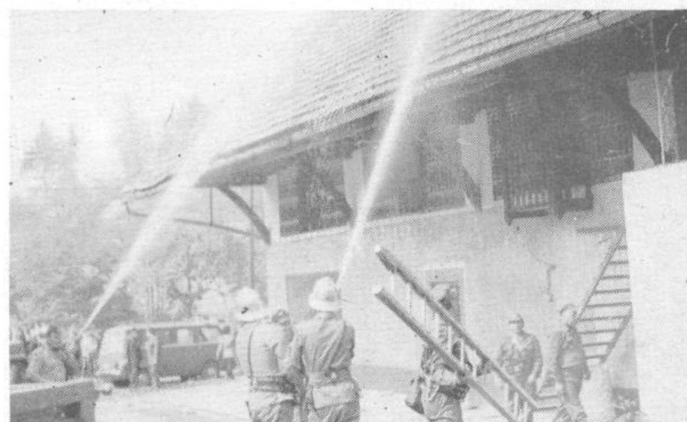
Hitre in učinkovite so bile enote gasilcev, na pomoč pa so prihiteli tudi gasilci iz Vnanjih in Notranjih goric ter Preserja.