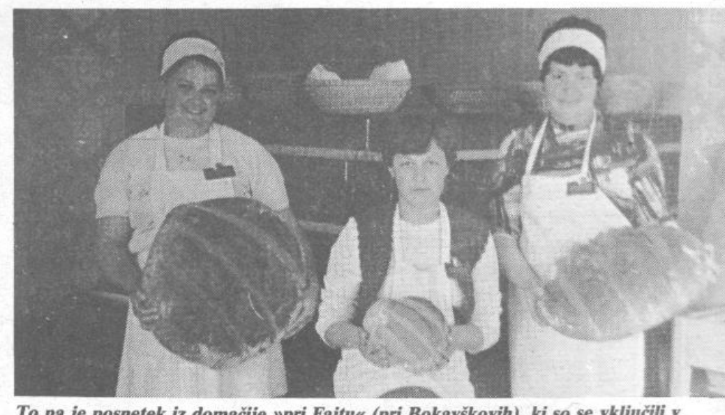
To pa je posnetek iz domačije »pri Fajtu« (pri Bokavškovih), ki so se vključili v peko kruha. V treh dneh so namreč na devetih domačijih spekli iz 800 kg moke 1003 kg kruha!