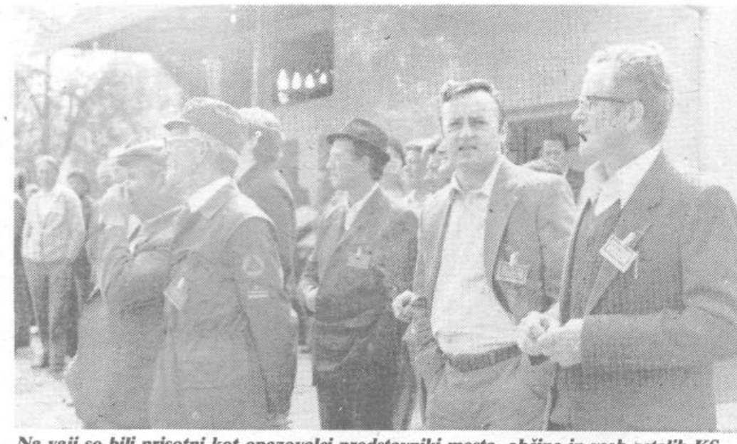
Na vaji so bili prisotni kot opazovalci predstavniki mesta, občine in vseh ostalih KS v občini, saj je bila ta vaja organizirana tudi za njih.