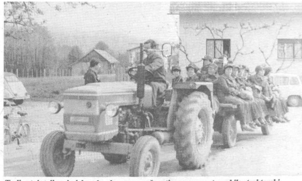
Tudi v tej vaji se je izkazalo, da ne gre računati samo na avtomobile, traktorski prevoz (na sliki enote prve pomoči) v takih situacijah ne gre zanemariti.