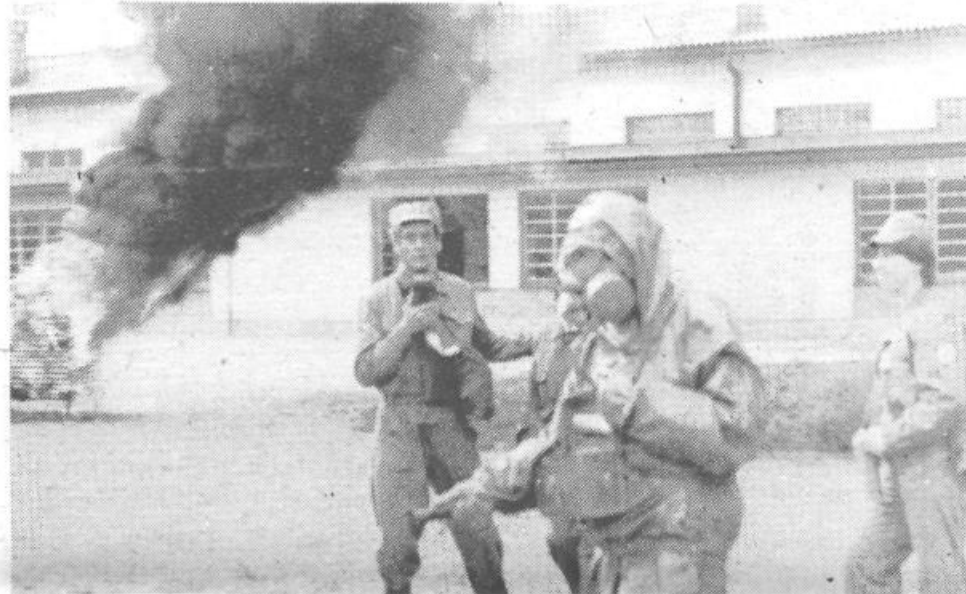
Po bombnem napadu so pripadniki enot radiobiološkokemične zaščite in civilne zaščite nemudoma ukrepali.