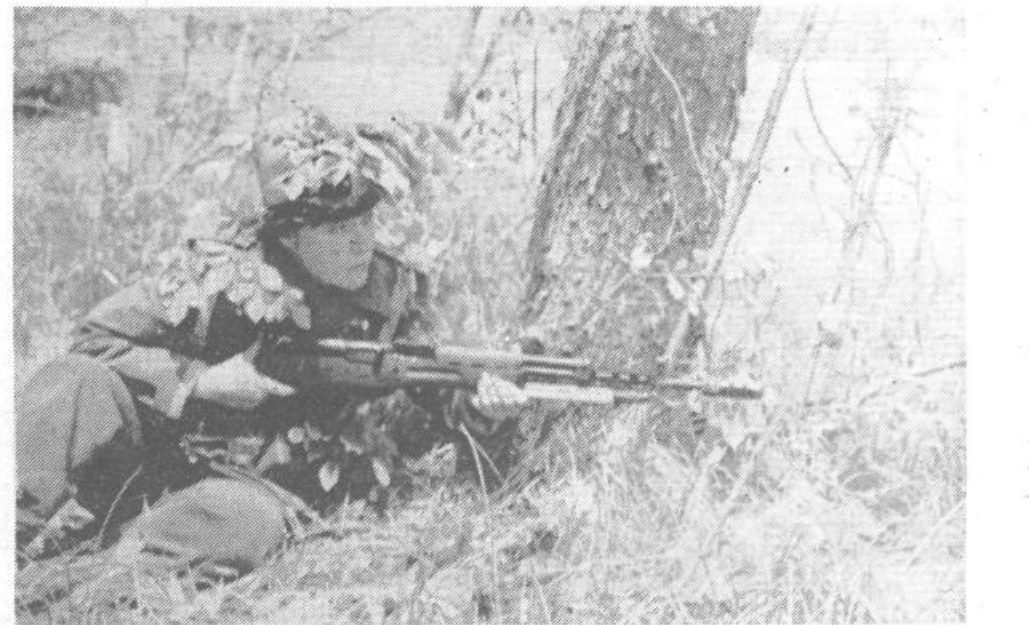
Pripadnica teritorialne obrambe KS Brezovica v zasedi v času akcije diverzantov.

uničili, vpokliče komite še krajanje, člane civilne zaščite, ki znajo ravnati z orožjem. Pričenja se zaključni boj. Mladinke, mladinci, teritorialci. Člani narodne zaščite, vsi stiskajo obroč, v katerem so se znašli vsiljevalci. Dvignjene roke peščice diverzantov! Zmagala je enotnost, klenost, socialistična prepričanost krajanov.