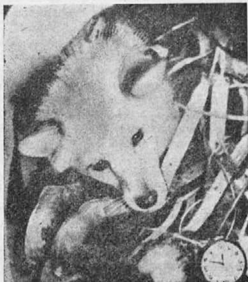
Lajka: prvi potnik po vesemirju

Po Tellerjevem mnenju je naloga Amerike, ki je na jedrnem področju brzkone še vedno razvitejša od Rusije, sedaj ta, da posveti atomskim raziskovanjem več denarja ter skupno dela z zavezniki. Naloga, ki jo je treba obvladati, se namreč ne tiče več le Združenih držav, temveč vseh svobodnih del na svetu.