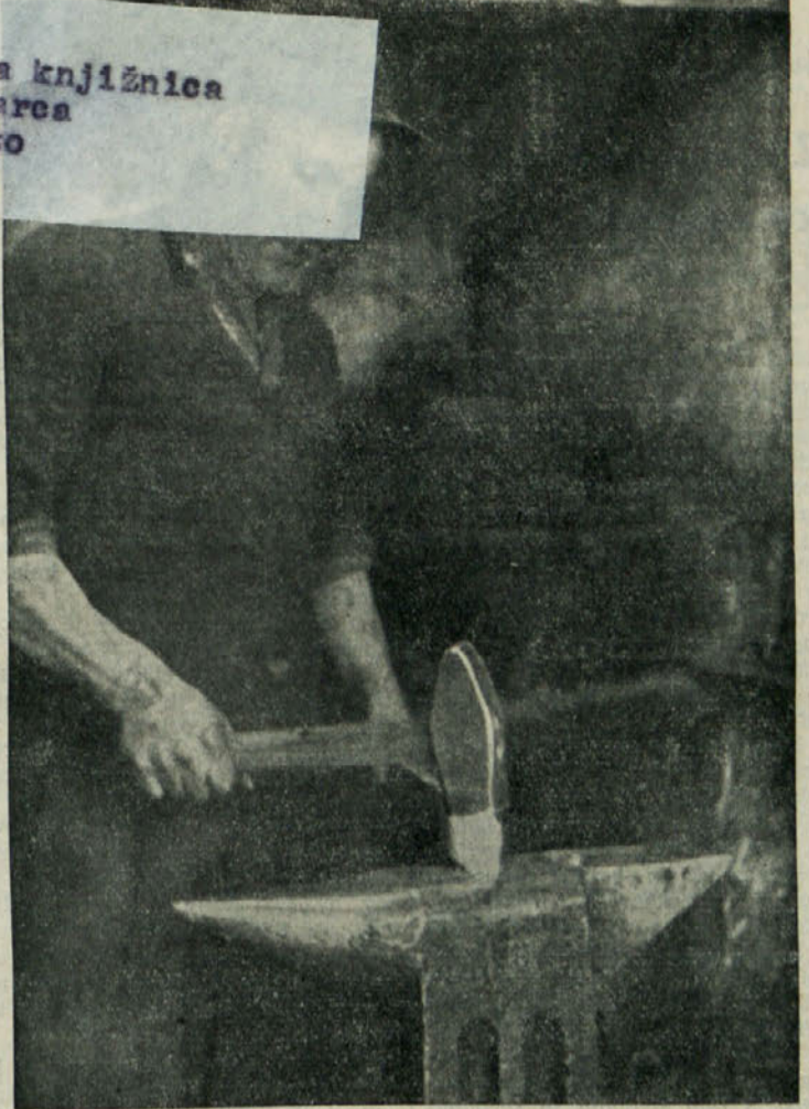
V novi socialistični domovini je delavec gospodar svojega orodja in bodočnost si kuje sam

Potrebno je poudariti, da izvažamo vedno več strojnih izdelkov v vse dele sveta.