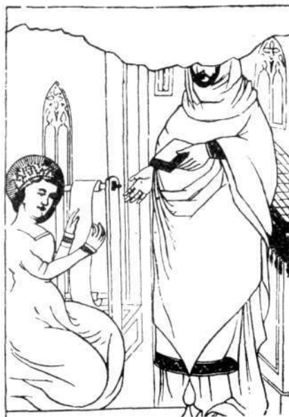
Detajl freske iz kapele gradu Weinegg pri Boznu z motivom pletenja