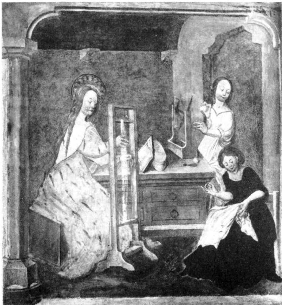
Motiv z Marijo pri tkanju, upodobljen na freski pri Sv. Primožu nad Kamnikom iz ok. 1520.

Med freskami iz cikla Marijinega življenja na južni notranji cerkveni steni je naslikana tudi Marija kot tempeljska devica, ki v družbi dveh deklet izdeluje tempeljske tkanine. Prizor je tako žanrsko naslikan, da je ta freska že večkrat služila kot ilustracija življenja meščanskih žena in deklet okoli leta 1520. 7