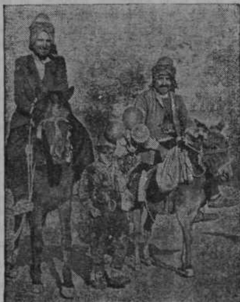
Pred dnevi se je poročil v Tirani albanski kralj Zogu z mažarsko grofico Appony. Na sliki vidimo albanska kmeta, ki jezdita k poročnim slovesnostim.

Proti tem ljudem je oblast že stotila potrebne korake. Nadalje ta JNSarski list