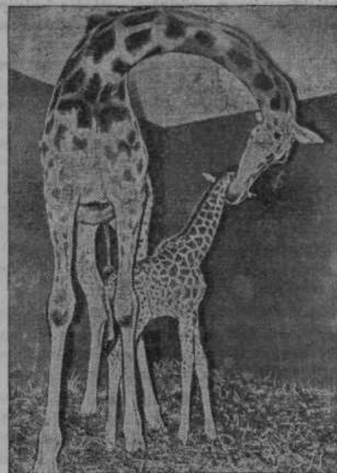
V živalskem vrtu v Hamburgu je povrgla afriška žirafa mladiča.

Smartno ob Paki. Še ni dolgo od tega, ko je nekdo v »Jutru« priobčil dopis, v katerem opisuje in obsoja neki pretep ter nespodobno obnašanje fantov (ki niso bili domačini). Pri tem je pa zlobno pripomnil, da so tozadevni fantje imeli znake »neke organizacije«. S tem je zlobno namigaval, da so bili ti fantje iz fantovskih odsekov katoliških prosvetnih društev. V »Slovencu«