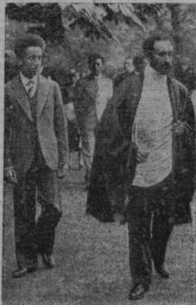
Haile Selassie, bivši abesinski cesar, s svojim starejšim sinom v Londonu.