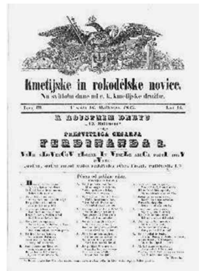
Naslovnica Kmetijskih in rokodelskih novic z dne 16. 4. 1845 s Prešernovo pesnitvijo Od železne ceste.

Liberalni časopis »Slovenski narod« je prinesel slavospev manifestaciji, ki se je je udeležilo več tisoč ljudi, in obenem napadel škofa Jegliča: »In zdaj se je dvignil tudi ljubljanski škof Anton Bonaventura Jeglič in je kakor kak obseden menih pljunil na veličasten spomenik, ki ga je hvaležen narod postavil svojemu največjemu sinu. Kadar se ljubljanski škof javno