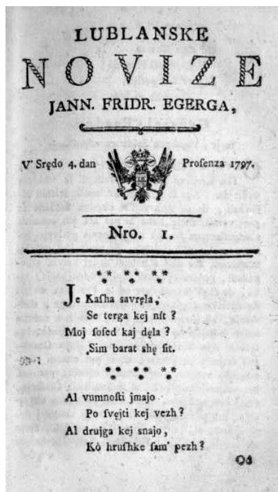
Prva številka Lublanskih novic z dne 4. 1. 1797.

Je bil torej prvi slovenski urednik le spretni medijski kopist? Nikakor, že v prve številke je vnašal avtorska besedila. Prva številka »Lublanskih novic« se namreč začne z njegovo pesmijo »O kaši«. Obenem pa je vpeljal neposredno poročilo, naj-sibo o cenah pšenice, turščice, ovs, izžrebanih številkah na lotu na mestni tržnici ali pa prek navajanja seznamov umrlih v minulih dneh. Njegovo snovanje časopisa je bilo dobesedno novinarsko iskateljstvo »per se«. V njegovem listu so se znašli celo oglasi, v katerih so prodajali grajska posestva in vinsko letino. Predvsem pa je uvedel formo reportaže, v kateri opisuje prihod Napoleona Bonaparteja skozi Ljubljano: »General Bonaparte je v Ljubljano prišel v petek zjutraj ob osmih, počival do pol enajstih, nato sprejel svoje generale, z njimi opoldne kosil, popoldne ob dveh pa se odpeljal naprej po Tržaški cesti. Prenočil je v škofiji in se ljudem pri oknu pokazal; videti je utrujen, vendar pravijo, da je trdnega zdravja.« 3