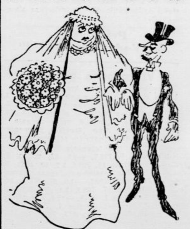
Poroka Moja draga, mala ženica, vedno te bom nosil na rokah!«