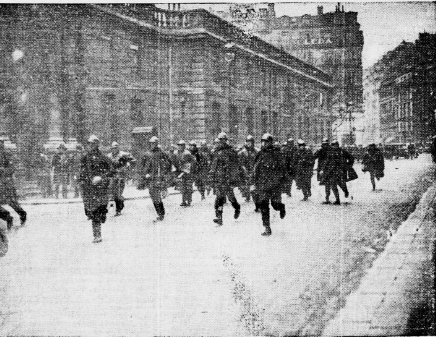
Iz težkih dni v Parizu: Policija ščiti Elizejsko palačo pred razburjenimi elementi