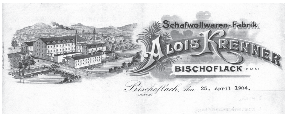
Krennerjeva tovarna in firma na poslovnem papirju.