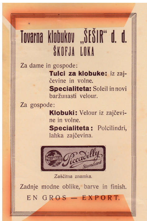
Predstavitveni letak Tovarne klobukov Šešir.