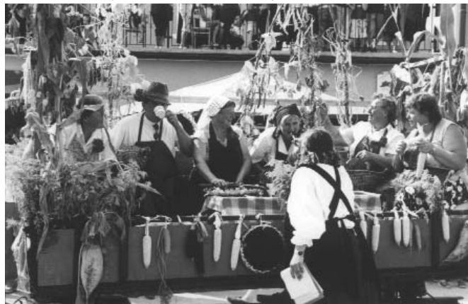
Vaščani Jiršovc so se udeležili povorke s 7 skupinami

konjsko vprego, kosilnica, nošenje trave, kolarstvo, kovaštvo, mlatenje pšenice (govorilo se je o mlatenju prazne slame občinskih svetnikov), stara gasilska pumpa, pučmašin, žrmle, luščenje koruze in drugega zrnja, peka kruha, ko-njska vprega z obračalnim plugom,