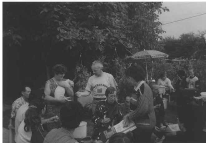
Vaški piknik 2001

Trudimo se, da bi bili vaščani složni, ker vemo, da bomo to, kar nam še manjka, ustvarili le s skupnimi močmi. Složni smo lahko le, če se dovolj poznamo in smo si dovolj »blizu«.