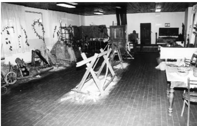
Utrinek iz razstave