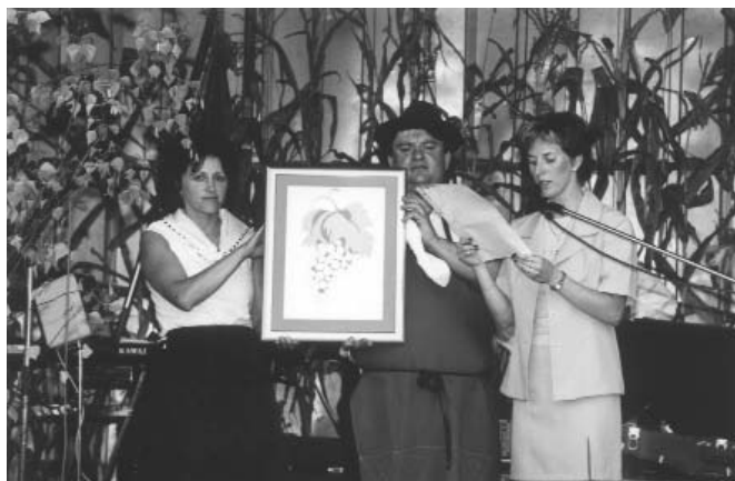
Predstavitve znaka društva