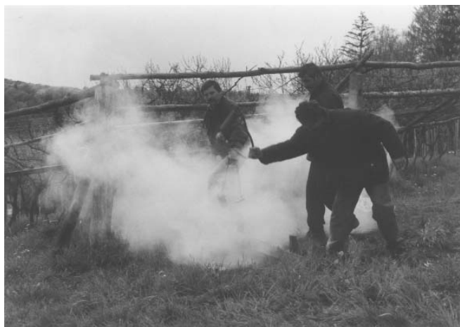
Streljanje z železi, Jiršovci

Danes je za nakup smodnika potreben orožni list. Prej so streljali kar na črno, nekaj streliva se je po vojni še potikalo okrog: »Po vojni je b'lo totiga vruga še puno!« »Švercali« pa so ga tudi iz Avstrije tisti, ki so delali zunaj in so se ob praznikih vračali domov. V 135 kilogramski možnar gre ¾ smodnika.