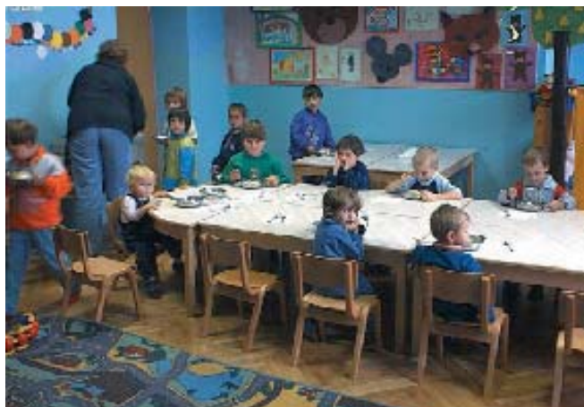
Utrinek iz vrta