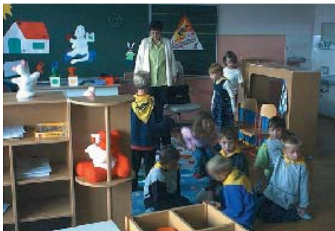
Učenci prvega razreda devetletke pri podaljšanem bivanju

Poletje je za nami, počitnice so minile in spet bo treba s torbico na rami vsako jutro v šolo z avtobusom ali peš. Nekateri so se počitnic že naveličili in so to z veseljem storili, drugi, predvsem prvošolčki, so to storili z merico strahu pred veliko stavbo pod topoli.