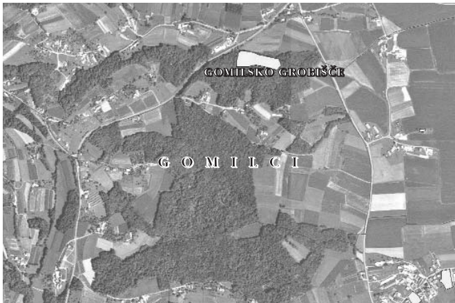
izsek geodetske karte z avionsko sliko kot podlago

Danes je v vasi 14 gospodinjstev in 14 hišnih številk, s tem, da so nekatere številke, ki imajo še a, b... Skupno število prebivalcev je 54 in narašča z novimi rojstvi in priselitvami.