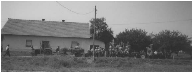
Priprava na odhod

Letos najštevilnejše zastopana vas v povorki je bila vas Jiršovci. Od lanskega leta, ko so v povorki sodelovale 4 skupine, je bila letos leta bogatejša še za 3 skupine. Tako je bilo skupno predstavljenih naslednjih 7 skupin: kovačija s pranjem in ožemanjem umazanega perila; pintarstvo, puc mašina, žrmlje, luščenje koruze; peka kruha in krapcov; konjska vprega z obračalnim plugom; mletje in stiskanje jabolk – priprava tukle; jesenska opravila na deželi v Slovenskih gor-icah.