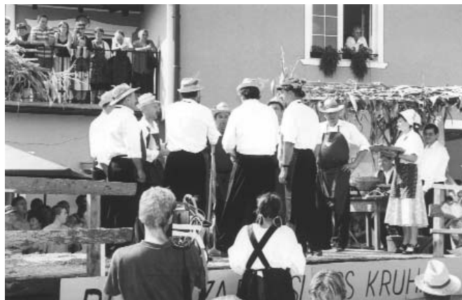
Člani občinskega sveta so delali za boljši kruh