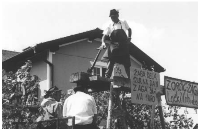
Vaščani Ločkega Vrha sodelujejo na kmečkem prazniku vseh 20 let

Praznovanja svoje 20. letnice so se lotili zelo previdno in organizirano. Povorka je presegla vse dosedanje, saj so v njej sodelovali vaščani vseh 17-ih destrniških vasi, ki se že dvajset let trudijo, da nekatera dela in opravila, ki niso več vsakdanja, ne bi utonila v pozabo. Sodelovali so tudi člani nekaterih društev in naključno sestavljene skupine. Upam si trditi, da so nastopajoči zaživeli s kmečkim praznikom, saj so dogajanje v povorki prikazali z dušo in srcem. Povorko sta pričela člana destrniške konjenice s praporjem in občinsko zastavo, nakar so zaigrali člani godbe na pihala. Letos so se odločili povorko prikazati na poseben način, in sicer tako kot potekajo opravila čez leto – po letnih časih. Pričeli so z zimo, ki so jo predstavljali kovačija, popravilo klopotca, čevljarstvo, slamoreznica, pintarstvo (sodarstvo), žganjekuha; pomlad – žagarji, priprava drv, gradnja koč, perilje ob veliki noči, vezanje trsva v gorici, nošnja kūr s traksлом; poletje – košnja s