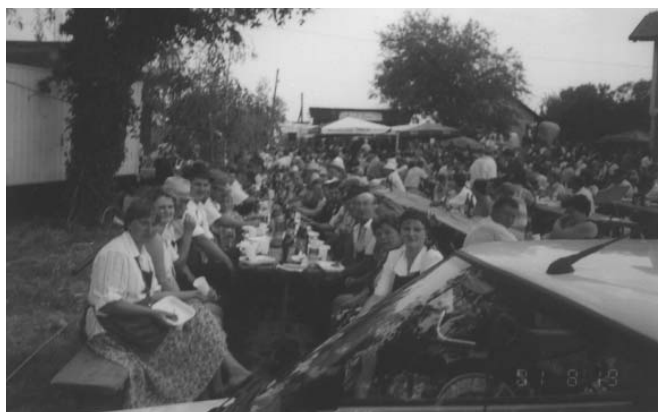
Tako so se poveselili in nazdravili po končani povorki

skupinsko delo ni tuje. Druženje bodo ponovili na jesenskem pikniku, saj predsednica želi, da bi se vaščani med seboj čimveč družili in si medsebojno pomagali, saj velja pregovor: »V slogi je moč.