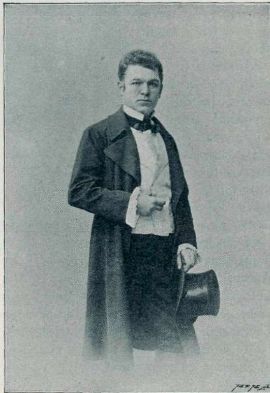
Tertnik kot „Evangelimann“. (V 1. dejanju.)

V petih letih je Tertnik pel nad 20 ulog, izmed katerih so bile njegove najboljše Manrico (Trubadur), Faust, Turiddu (Cavalleria rusticana), Canio (Bajazzo), Lohengrin, Tannhäuser in posebno Evangelimann. Znal je pa razven teh še kakih šest do osem oper, v katerih ni imel prilike nastopiti. Pač lepo število, lep uspeh za tako kratko dobo! In res, občudovati moramo Tertnikovo nadarjenost, njegovo iskreno navdušenje in neumorno delavnost, ako pomislimo, da se je brez primerne pripravljalne šolske podlage v osmih do devetih letih od preprostega obrtnika iz lastne moči pospel na višek umet-